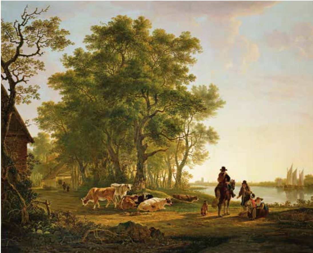
7 JACOB VAN STRIJ, Landschap met geboorte en vee in de omgeving van Dordrecht , paneel, 69,4 x 87,5 cm, Dordrecht, Dordrechts Museum