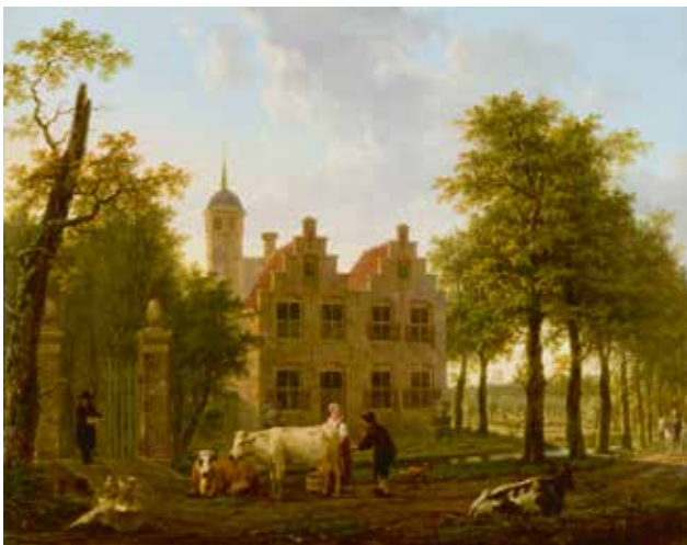
8 MICHEL VAN DEN BROEK, Huize Dortwijk , ca. 1837, paneel, 56 x 72,6 cm, Dordrecht, Dordrechts Museum (langdurig bruikleen van particulier)