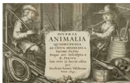
1 REINIER VAN PERSIJN naar JACOB GERRITZ. CUYP, Boer en melkmeid in een stal , titelprint (1) uit de serie Diversa Animalia Quadrupedia , 1641, gravure, 129 x 198 mm, Dordrecht, Dordrechts Museum

Reiss 1975, nr. 83; Chong 1988, p. 77-78, afb. 75; MacLaren & Brown 1991, nr. 961, afb. 78; Chong 1992, nr. 114 (met eerdere literatuur en tentoonstellingen); Jensen Adams 2002, p. 59-62, afb. 2.15; Spring & Keith 2009