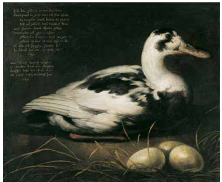
1 AELBERT CUYP, Portret van de 20-jarige eend Sijctghen , 1647/50, paneel, 35 x 41,5 cm, Dordrecht, Dordrechts Museum

Hoewel een van de late meesterwerken van Cuyp tegenwoordig in de eregalerij van het Rijksmuseum te bewonderen is (cat.nr. 28), 5 blijft Veths opmerking actueel – en onbedoeld ook relevant – voor het onderwerp van deze catalogus en de bijbehorende tentoonstelling: Aelbert Cuyp en zijn impact op Britse schilders. Het merendeel van Cuyps belangrijkste schilderijen is namelijk nog altijd te vinden in Engelse verzamelingen. Bovendien is het belang of de 'werkelijke beteekenis' van Cuyps werk niet alleen af te meten aan de kwaliteit ervan, maar ook aan de invloed die het had op latere schilders. Deze tentoonstelling geeft voor het eerst een breed beeld van de invloed die Cuyp in Engeland heeft gehad en laat zien hoe