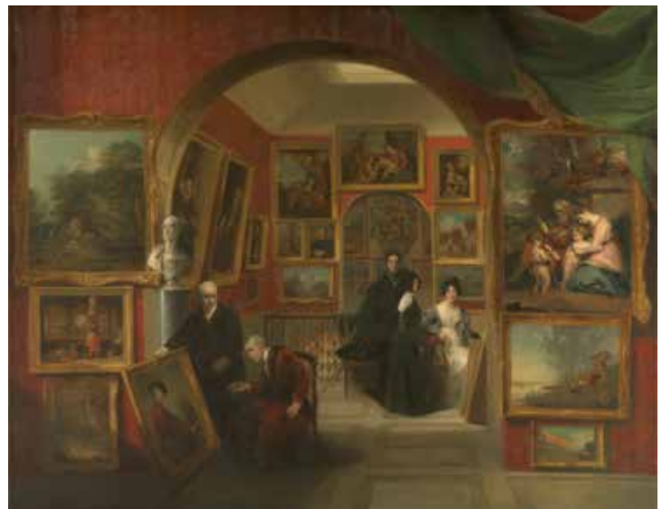
10 JOHN SCARLETT DAVIS, Interieur van de British Institution Gallery, 1829 , doek, 113 x 142,2 cm, New Haven, Yale Center for British Art, Paul Mellon Collection

Een van de mooiste voorbeelden van zo'n interieur is John Scarlett Davis' (1804-1845) Interieur van de British Institution met daarop afgebeeld de tentoonstelling van oude meesters in 1829 (afb. 10). 34 Rechts is Cuyps Landschap met koeien en melkmeid te zien dat tegenwoordig in het Norton Simon Museum in Pasadena hangt (afb. 11). Een ander mooi voorbeeld is een cartoon door de Britse illustrator John Leech (1817-1864) van een naïeve bezoeker aan de National Gallery die juist schilderijen van Cuyp bekijkt (afb. 13). De grap die gemaakt wordt over de jaartallen op het bordje heeft niets met Cuyp te maken, maar laat wel zien hoe lang na Houbraken nog het verkeerde geboorte- en sterfjaar van Cuyp werden gebruikt. Uiteindelijk zou de vader van Jan Veth de juiste gegevens in het archief vinden en in 1884 publiceren.