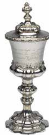
Beker ‘bewijs van liefde en gehechtheid van de bewoners van de Willemsstraat aan onze beminden koning Willem III’, 1861.

Amsterdam was sinds het begin van de negentiende eeuw hoofdstad en daarmee de plaats van inhuldiging van de koning. Drie Willems sloten in de Nieuwe Kerk het verbond tussen vorst en vaderland. Hun jaarlijkse bezoeken aan de hoofdstad en vooral verjaardagen en jubilea leidden tot uitbundige uitingen van Oranjeliefde, met name in de volkswijken, zoals de Jordaan en Kattenburg. De bewoners timmerden dan erepoorten en versierden de straten. Groepsgewijs, oranjeliederend zingend, trokken ze door elkaars versierde buurten. De meeste Amsterdammers kwamen gewoonlijk nauwelijks buiten hun eigen wijk en de Oranjefeesten droegen ertoe bij dat zij zich hun stad meer eigen maakten. 3 Een joodse groentevrouw liep in 1863 samen met anderen uit de Jodenbuurt naar de Jordaan om met ‘die brave Willemsstraters een hoezee voor Koning en Vaderland aan (te) heffen’. De tranen sprongen haar in de ogen toen ‘die arme Joden met de arme Christenen zoo broederlijk en zusterlijk feest vierden’. 4