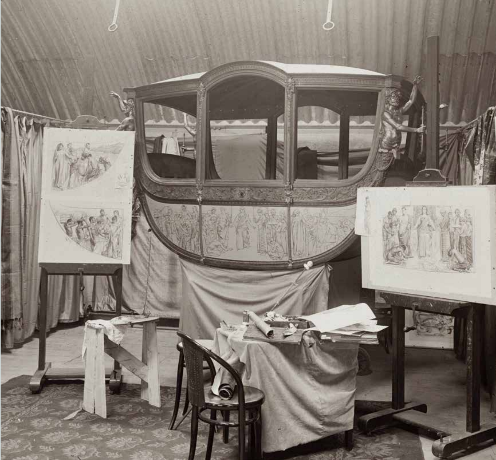
Beschildering van de Gouden Koets in de fabriek Gebroeders Spyker, 1898.