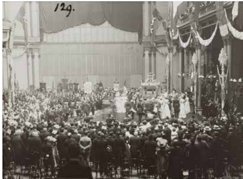
Aanbieding van de Gouden Koets aan koningin Wilhelmina in het Paleis voor Volksvlijt, 7 september 1898.

Met andere woorden: de Gouden Koets is meer dan simpelweg een vervoermiddel van de koning of koningin. Hij staat symbool voor het koningshuis. Voor velen iets om voor te juichen, voor anderen iets om je bij af te vragen of het nog wel van deze tijd is of je tegen te verzetten. Wat niet veel mensen weten is dat de Gouden Koets een geschenk van de