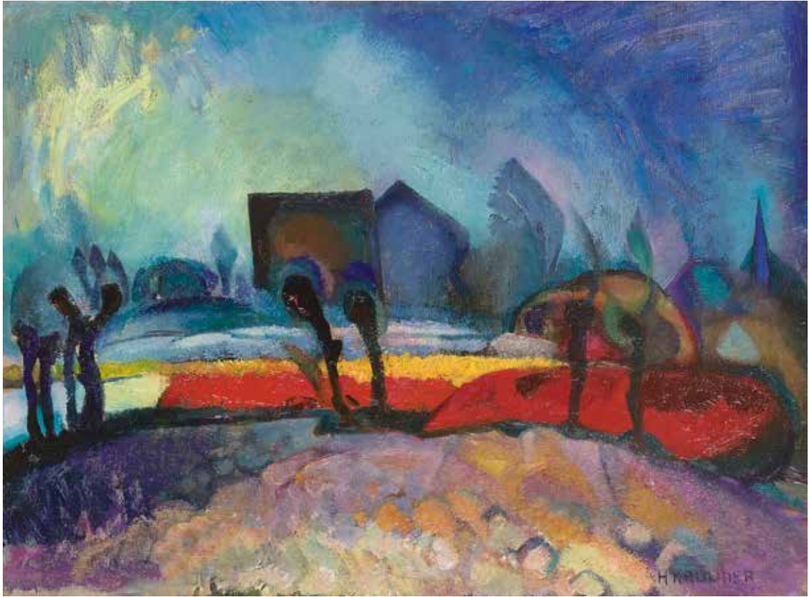
Herman Kruyder , Bollenveldjes , ca. 1920, olieverf op doek, 41,9 x 56,3 cm, particuliere collectie, voorheen Simonis & Buunk, Ede