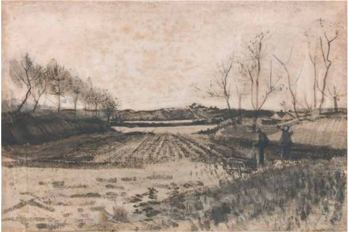
Vincent van Gogh, Aardappelveld in de duinen, 1883, drukinkt met waterverf, 28,6 x 42,9 cm, Kröller-Müller Museum, Otterloo