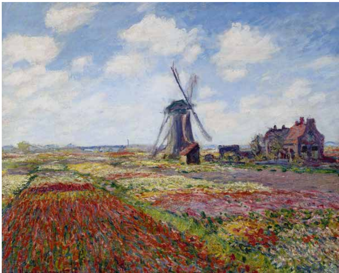
Claude Monet , Bollenveld met windmolen van Rijnsburg , 1886, olieverf op doek, 65,0 x 81,0 cm, Musee d'Orsay Parijs