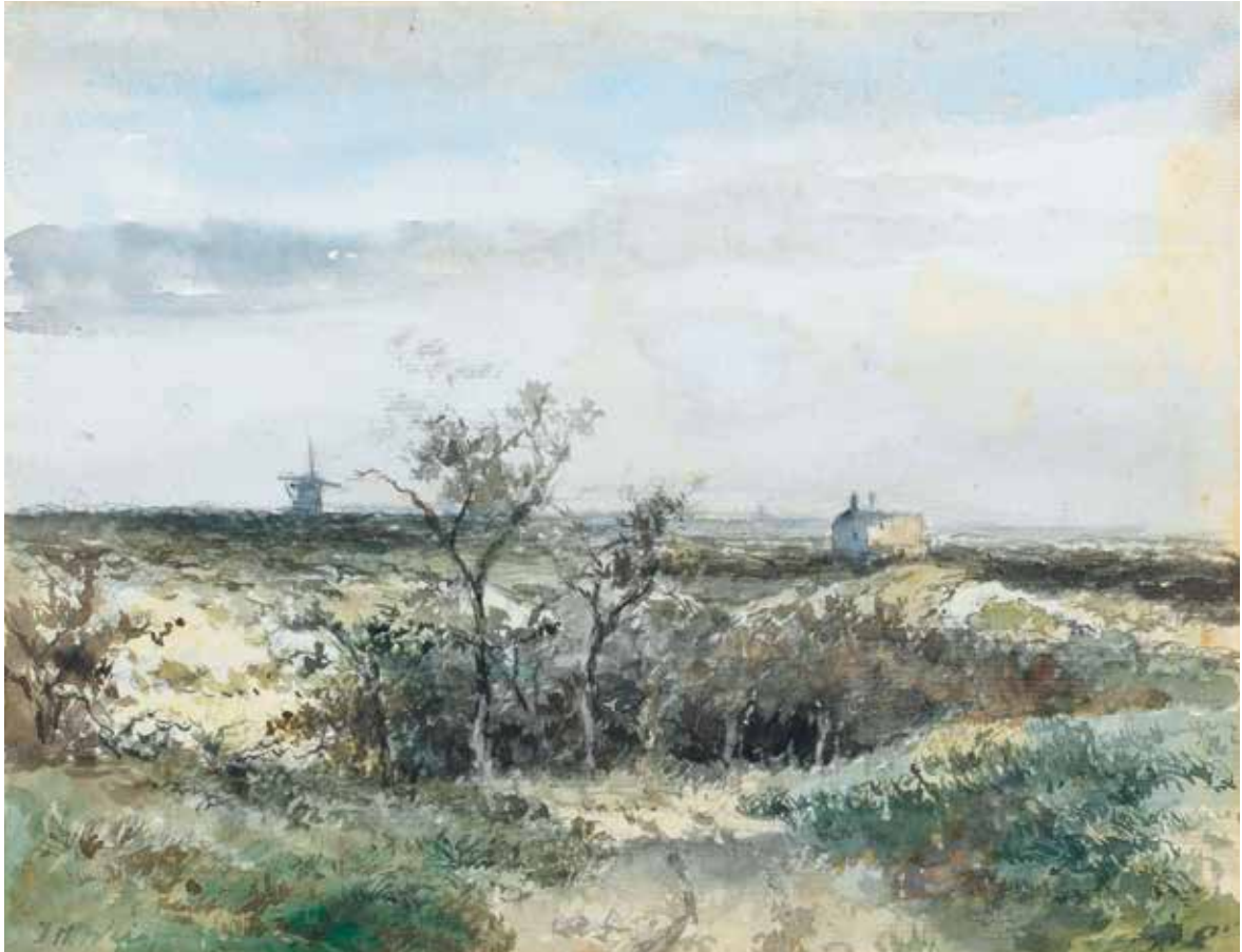
Johan Hendrik Weissenbruch , Gezicht op het Dekkersduin, met oude gasfabriek en molen in het verschiet , 1834-1903, krijt en waterverf, 207 x 264 mm, Rijksprentenkabinet, Amsterdam