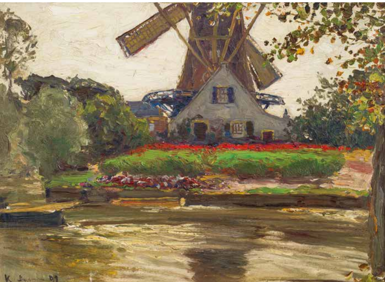
Hans von Bartels , Molen 'De Gerechtigheid' Katwijk aan den Rijn , 1897, olieverf op board, 33 x 45,5 cm, Katwijks Museum