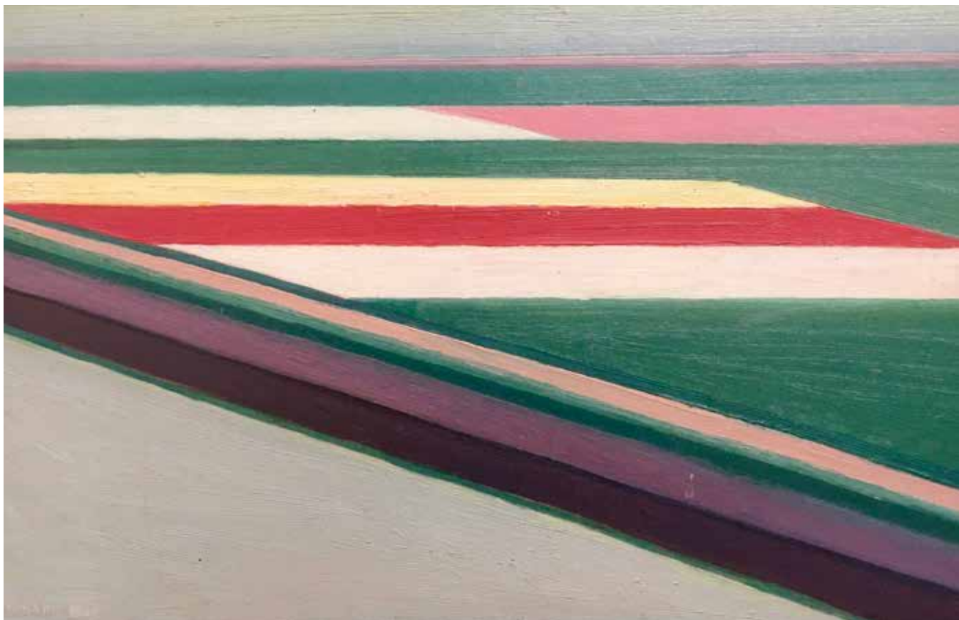
Theo Lohmann, Abstrakte bollenvelden , 1929, olieverf op board, 26,5 x 41,5 cm, Museum Belvédère, Heerenveen