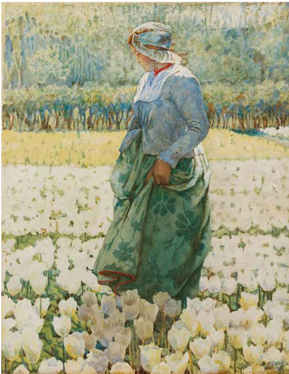
Agnes Gardner King , In het tulpenveld , 1913, aquarel op papier, 47,4 x 37,3 cm, particuliere collectie, voorheen Simonis & Buunk, Ede