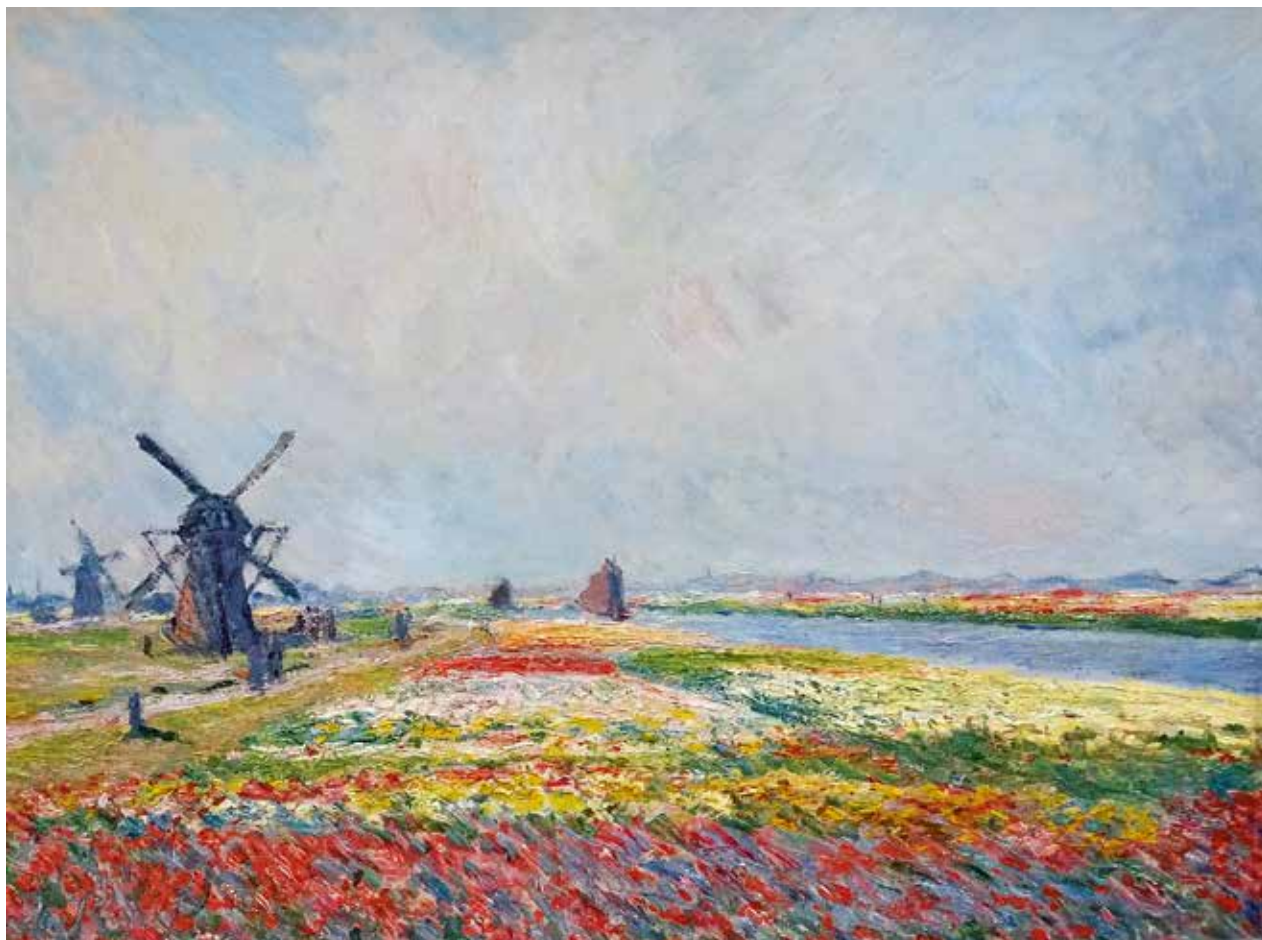
Claude Monet , Bollenvelden bij Oegstgeest en Rijnsburg , 1886, olieverf op doek, 65,0 x 81,0 cm, Van Gogh Museum, Amsterdam/ Rijksdienst voor het Cultureel Erfgoed, Amersfoort