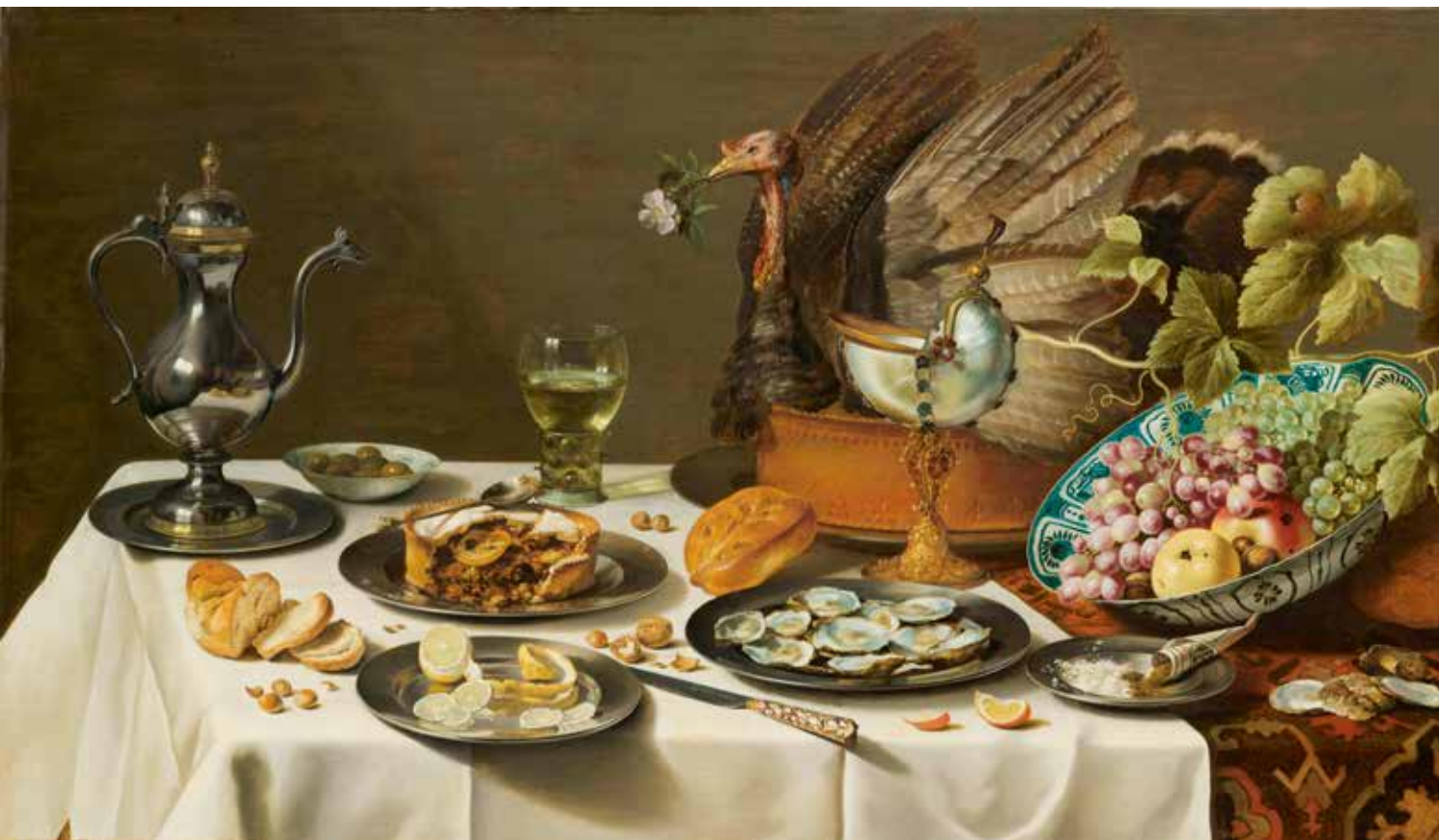
Pieter Claesz, Stilven met kalkoenpastei, 1627, olieverf paneel, 75 x 132 cm, Rijksmuseum, Amsterdam, voorheen collectie Keukenhof

Dit schilderij van Pieter Claesz maakte deel uit van de oorspronkelijke kunstcollectie van Keukenhof. In 1974 kwam het werk mede dankzij de Vereniging Rembrandt in de collectie van het Rijksmuseum.