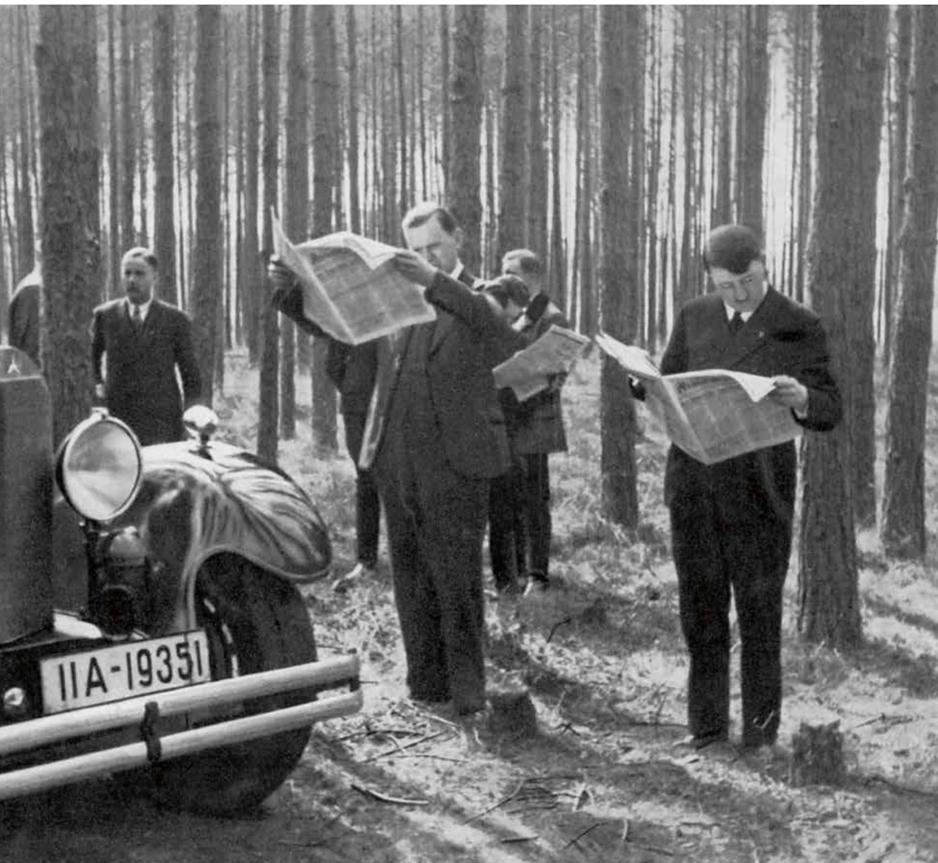
Adolf Hitler (rechts) en entourage staan bij zijn Mercedes kranten te lezen, begin jaren '30 in Duitsland.