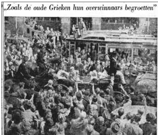
„Zoals de oude Grieken hun overwinnaars begroetten” Amsterdam was onherkenbaar gistermiddag. Lange rijen trams stonden geduldig te wachten op het moment, dat zij zich een doortocht konden boven door de duizenden, die straten en pleinen bevolkten, om Fanny Blankers-Koen te zien. Zo in acten de oude Grieken hun overwinnaars hebben begroet,” zei burgemeester d'Ailly in de raadzaal. En op de dakken van huizen en gebouwen en boven op de trams werden enthousiaste sprekers en zingvaren: „Fanny, Fanny, Fanny!” In het rijtuig zat een slanke vrouw, weggedoken tussen bloemen en geruchten, die in een droom stond naar de vier vieroudige.