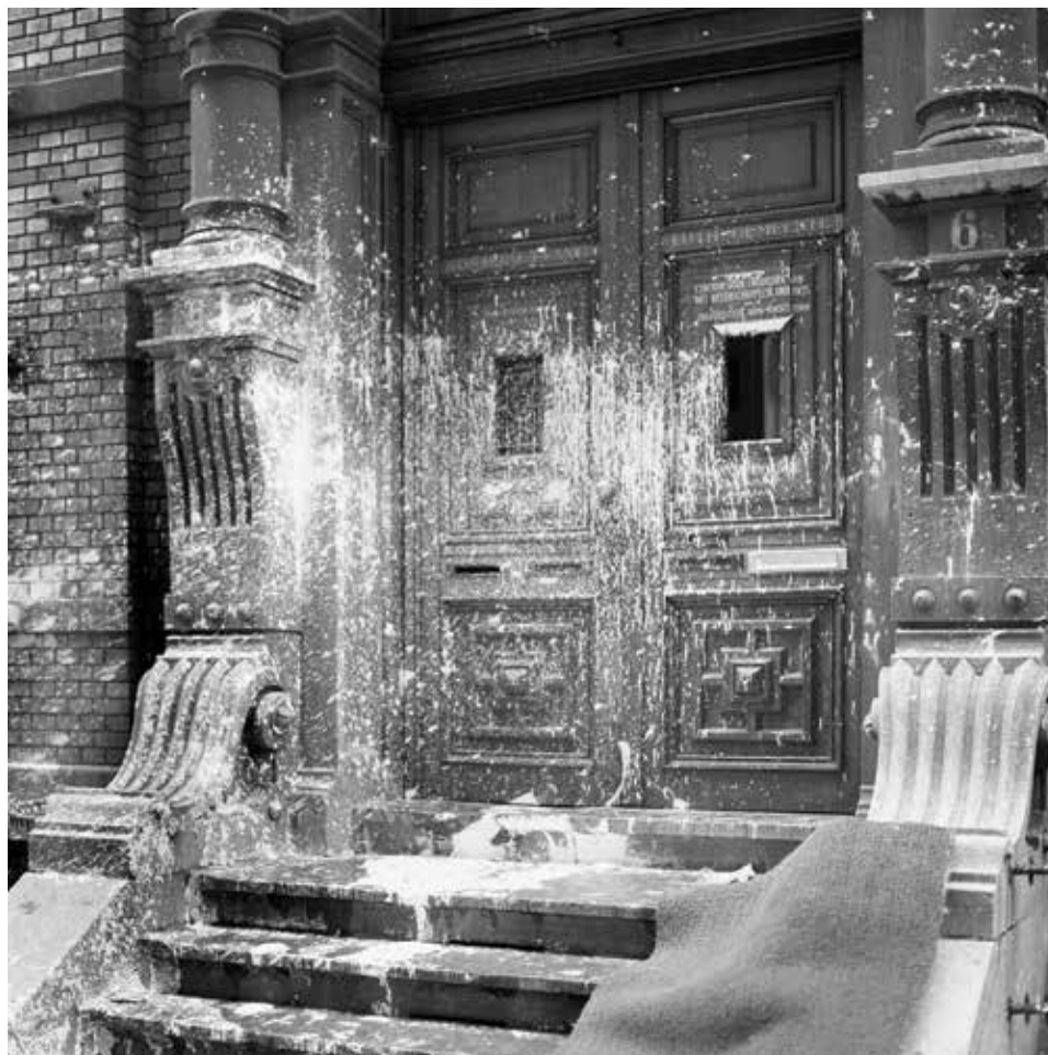
Deur van het Maagdenhuis op het Spui in Amsterdam, 20 mei 1969.