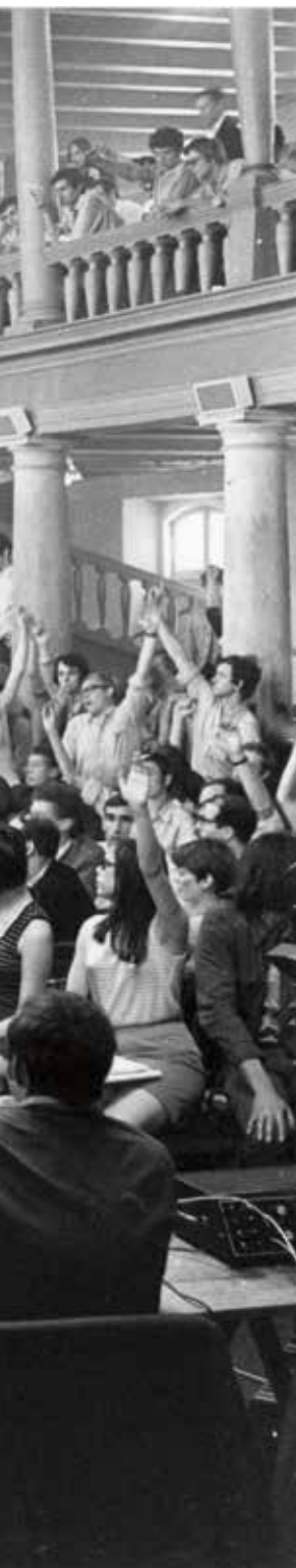
Stemming tijdens de bezetting van het Maagdenhuis, 13 mei 1969.