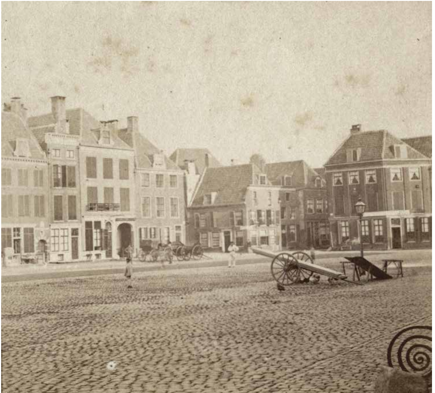
De oudst bekende foto van de Neude met een gezicht op de noordwesthoek van het plein, 1859-1860. (De afbeelding vormt het rechterdeel van een stereofoto).