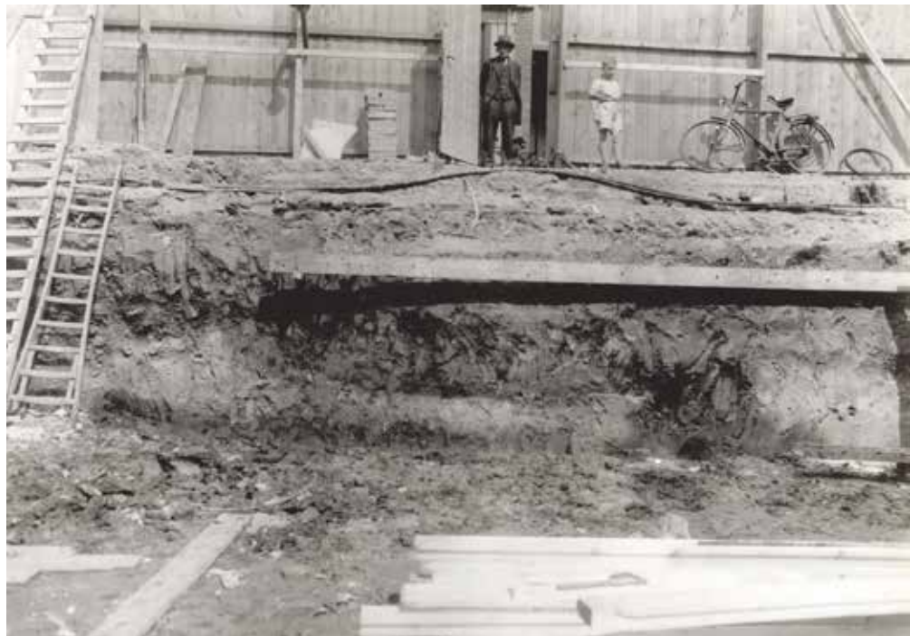
De graafwerken op de Neude. Op de hierboven afgebeelde plaats werden eenige geraamten gevonden. Zelfs na hun dood geen rust....