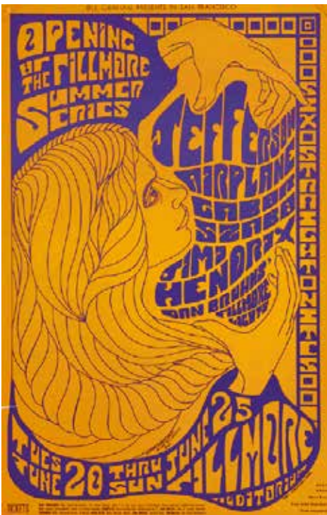
Psychedelische poster van de Fillmore met op het programma de Jimi Hendrix Experience en Jefferson Airplane.

Mitch Mitchell, Jimi Hendrix en Noel Redding in augustus 1967. De verovering van Amerika is al begonnen.