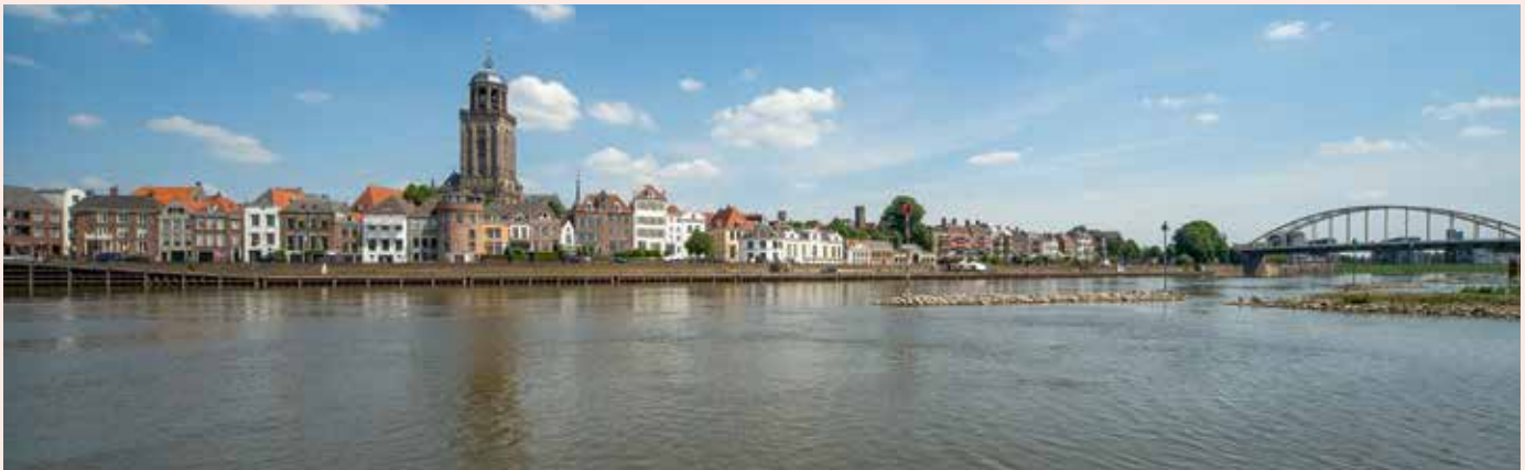
› Deventer gezien vanaf de overkant van de IJssel.

Maar niet alleen in het kerkelijk bestuur was Deventer ondergeschikt aan de Utrechtse kerkvorst. Dat was ook het geval voor het wereldlijke gezag. De bisschop was de hoogste gezagsdrager in de Utrechtse landsheerlijkheid, bestaande uit de tegenwoordige provincies Utrecht (het Sticht) en Overijssel, Drenthe en enkele omliggende gebieden (het Oversticht). In dit laatste gebied Over-de-IJssel gold Deventer als hoofdstad. Kerkelijk en wereldlijk gezag vielen hier samen. De steden in de landsheerlijkheid waren echter weinig gediend van hun heer. Zij stelden zich zo zelfstandig mogelijk op en konden dat doen dankzij de vele *privileges die zij zich verwier-