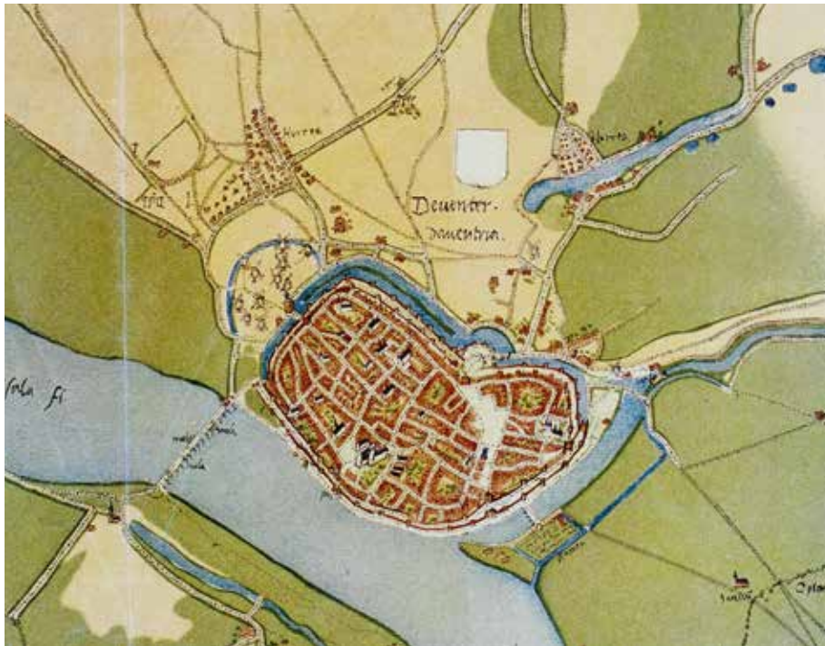
› Historische stadsplattegrond van Deventer, getekend door Jacob van Deventer, 1560/1561.

ven. De bisschop zat dikwijls in geldnood en was dan genoodzaakt aan de steden grote geldsommen te vragen. Zij wilden dergelijke verzoeken wel honoreren, mits daar uitbreiding van hun rechten tegenover stond. Zo verwierf Deventer zich vanaf de elfde eeuw een steeds grotere mate van zelfstandigheid met eigen wetgeving, bestuur en rechtspraak, eigen munten, tolleren en markten. Uiteindelijk pretendeerde het een 'Keizerlijke Vrije Rijksstad' te zijn. Slechts aan de Duitse keizer zou zij ondergeschikt zijn, de macht van de bisschop was weggeredeneerd. Dat was wat al te mooi bedacht, al bracht een bode een enkele keer een uitnodiging voor deelname aan een Duitse Rijksdag. Soeverein was Deventer nooit, hooguit een 'Territorialstadt', een plaats in een bisdom met een grote mate van autonomie. Binnen Deventer bloeide het kerkelijk leven. De *kapittelkerk van Sint-Lebuïnus, vernoemd naar de eerste missionaris, had een grote uitstraling en daar vierden de *kanunniken en *vicarissen een luisterrijke liturgie. Voor de bewoners waren er twee parochiekerken: die van Onze-Lieve-Vrouw (Maria) tussen het Grote Kerkhof en de Bisschopshof (later Nieuwe Markt) en die van Sint-Nicolaas op de Berg. Vanaf ongeveer