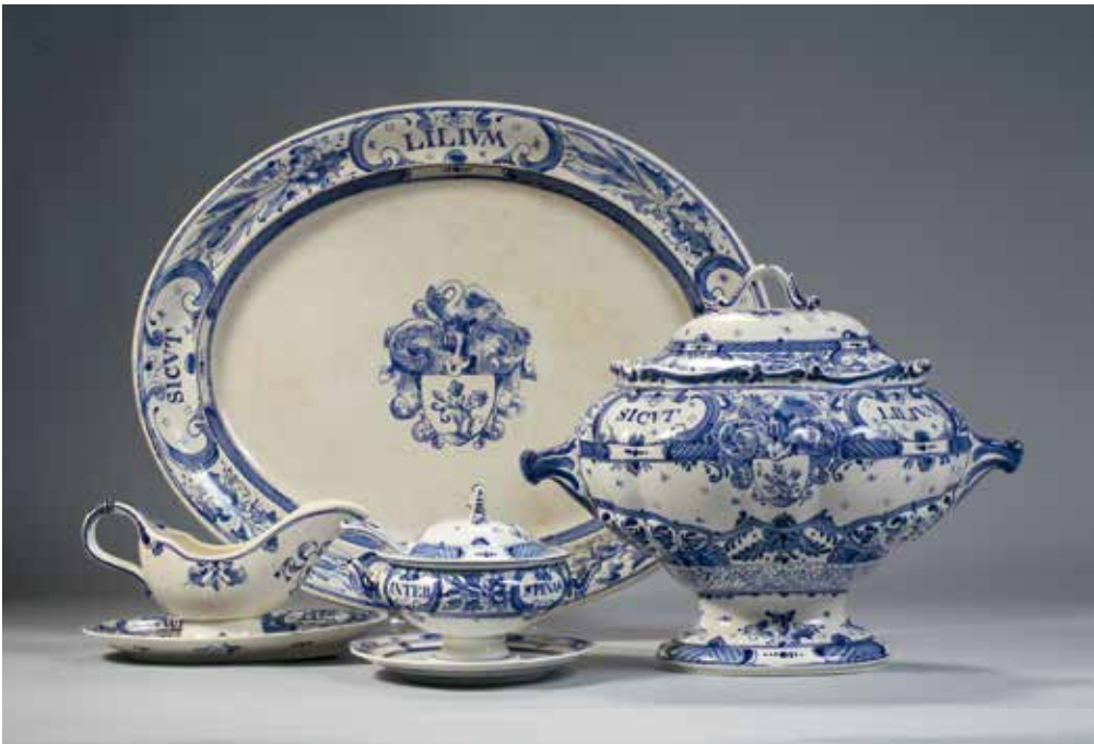
Servies Ten behoeve van de jaarlijkse broederlijke maaltijd gaf de broederschap aan het einde van de negentiende eeuw opdracht aan De Porceleynse Fles in Delft voor de vervaardiging van een 560-delig servies in blauw en wit, voorzien van het bekende embleem en devies. MUSEUM HET ZWANENBROEDERSHUIS, 'S-HERTOGENBOSCH