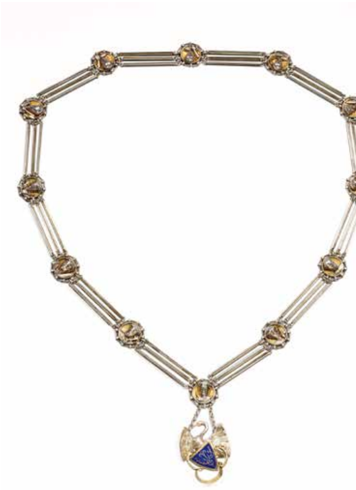
Keten van de regerend proost De vier broeders met de meeste anciënniteit uit elke lijn dragen de titel van proost. In totaal zijn er dus acht proosten. Zij vervullen deze functie maximaal 12 jaar of tot de leeftijd van 72 jaar. Jaarlijks en gelijkelijk verdeeld over de lijnen rouleren binnen de groep van proosten de functies van regerend en toezienend proost. MUSEUM HET ZWANENBROEDERSHUIS, 'S-HERTOGENBOSCH