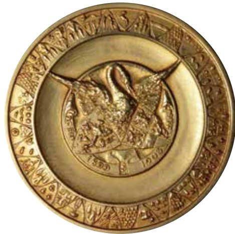
Penning van het zesde eeuwfeest Het zesde eeuwfeest werd in verband met de Eerste Wereldoorlog niet gevierd. Wel werd toen een gedenkpenning geslagen, naar ontwerp van Huib Luns. MUSEUM HET ZWANENBROEDERSHUIS, 'S-HERTOGENBOSCH