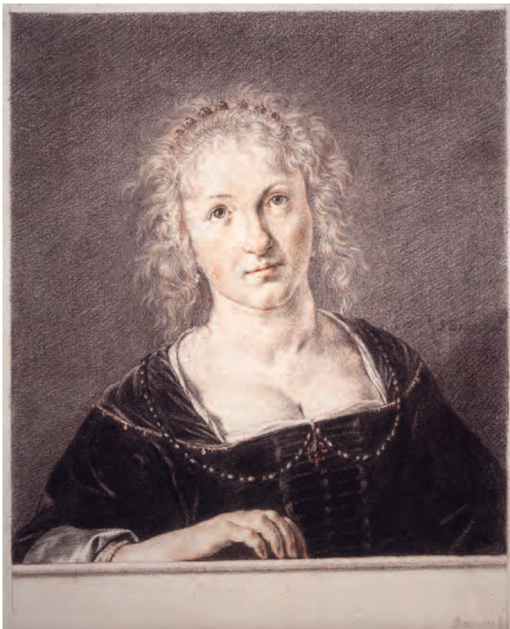
Cat. nr. T5