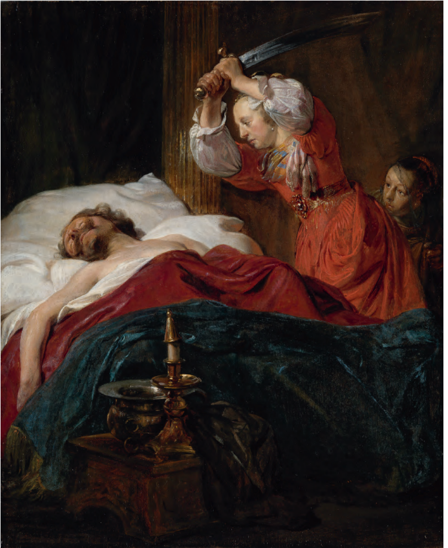
Cat. nr. 20