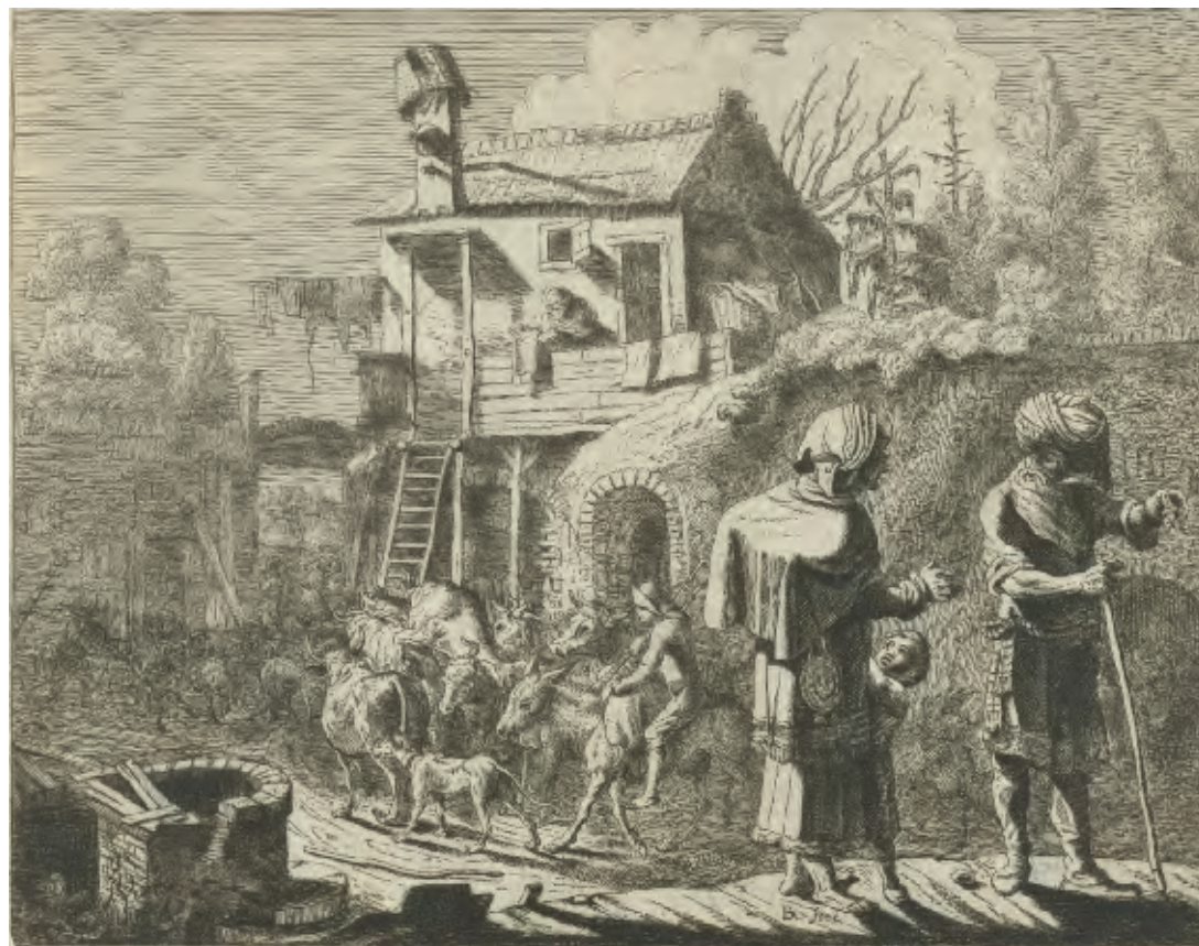
Cat. nr. E1

De prent ging net als Hollstein nr. 7 volgens Van der Kellen