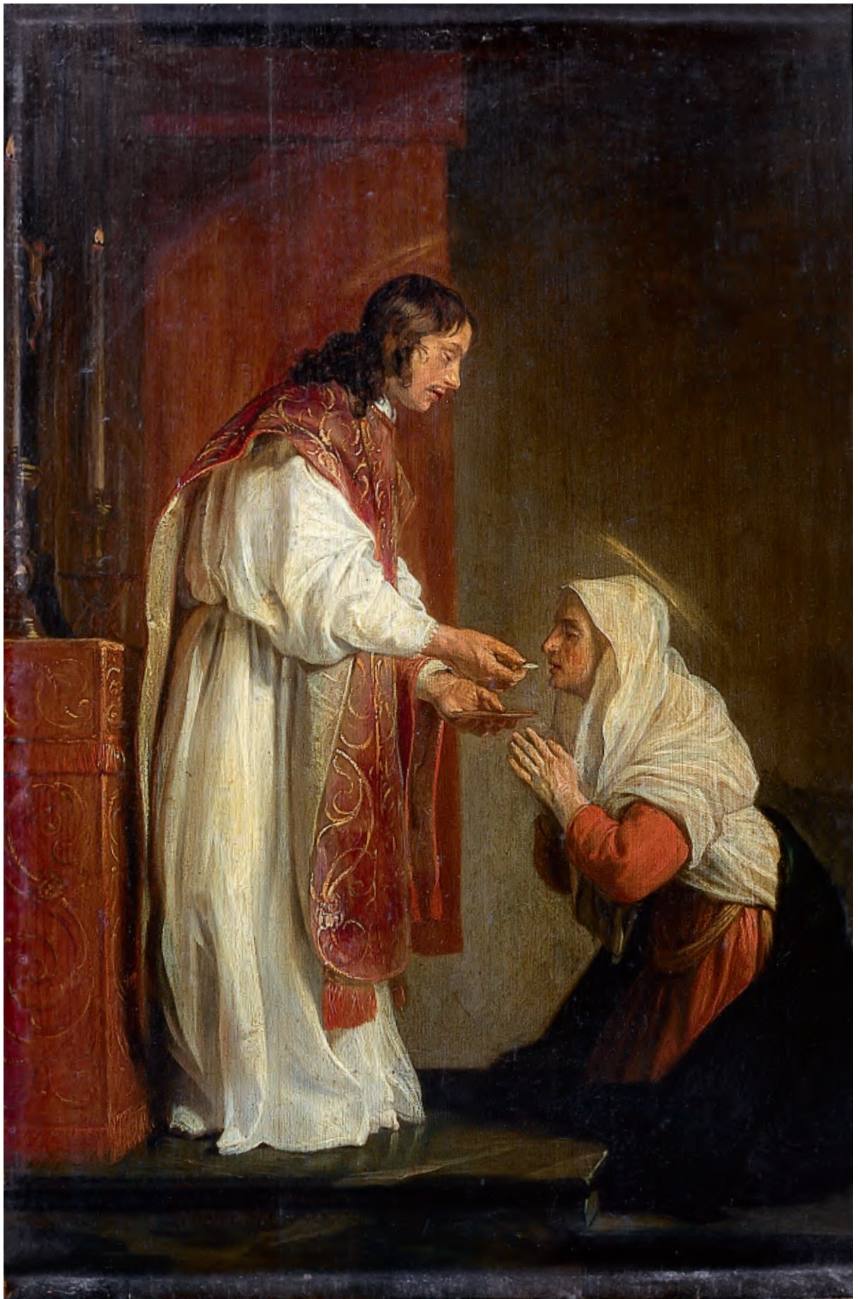
Cat. nr. 7