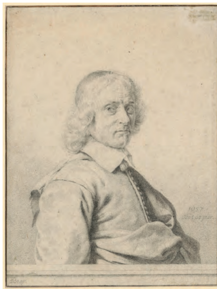
4 Jan de Braij, Portret van Salomon de Braij , potlood, 214 x 161 mm. Links onder gesigneerd met potlood: 'JDBraij (JDB in een)', rechts onder met potlood geannoteerd: '1657./ouwt 60 jaar' (cat. nr. 128). Berlijn, Staatliche Museen zu Berlin Preussischer Kulturbesitz, Kupferstichkabinett

Hij tekende in 1634 een cartouche, die onder het rugpositief van het vernieuwde orgel in de Grote Kerk in Haarlem kon worden geplaatst, maar die is niet uitgevoerd 56 , als ook 'kelcken, bossen ende monstrancen', waarvan de tekeningen bij zoon Jan terecht kwamen, die deze laat vermelden in zijn testament van 1664