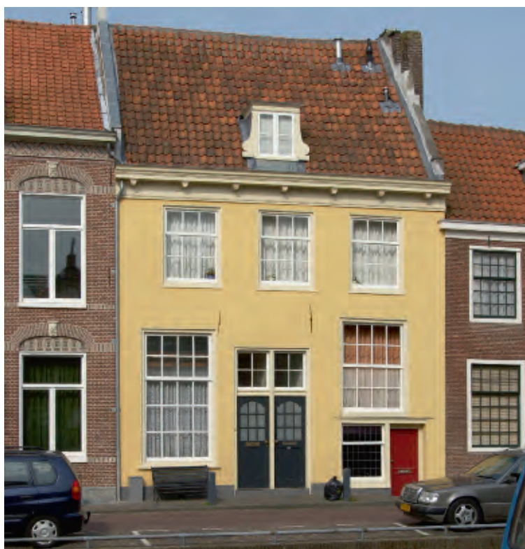
3 Het huis in Haarlem aan de Bakenessergracht nr. 32.

Salomon was bevriend met de componist Cornelis Padbrué (ca. 1592-1670), die in 1631 de bundel Kusjes uitbracht. Daarvan