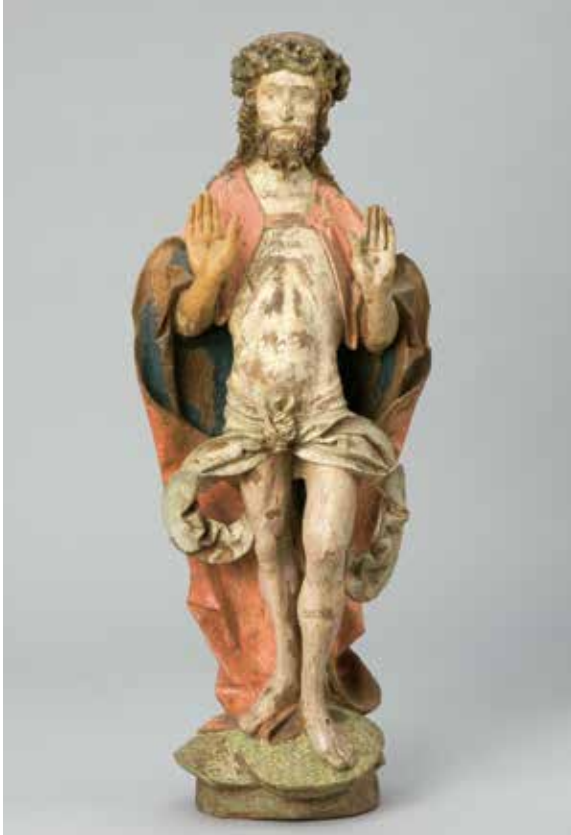
Afb.9 Christus als Man van Smarten, Meester van Osnabrück (zogenaamde Schnetlage-meester? ), ca. 1520, beschilderd eikenhout, 67 x 27 x 20 cm, Münster, LWL-Museum für Kunst und Kultur (Westfälisches Landesmuseum), E 490 LM