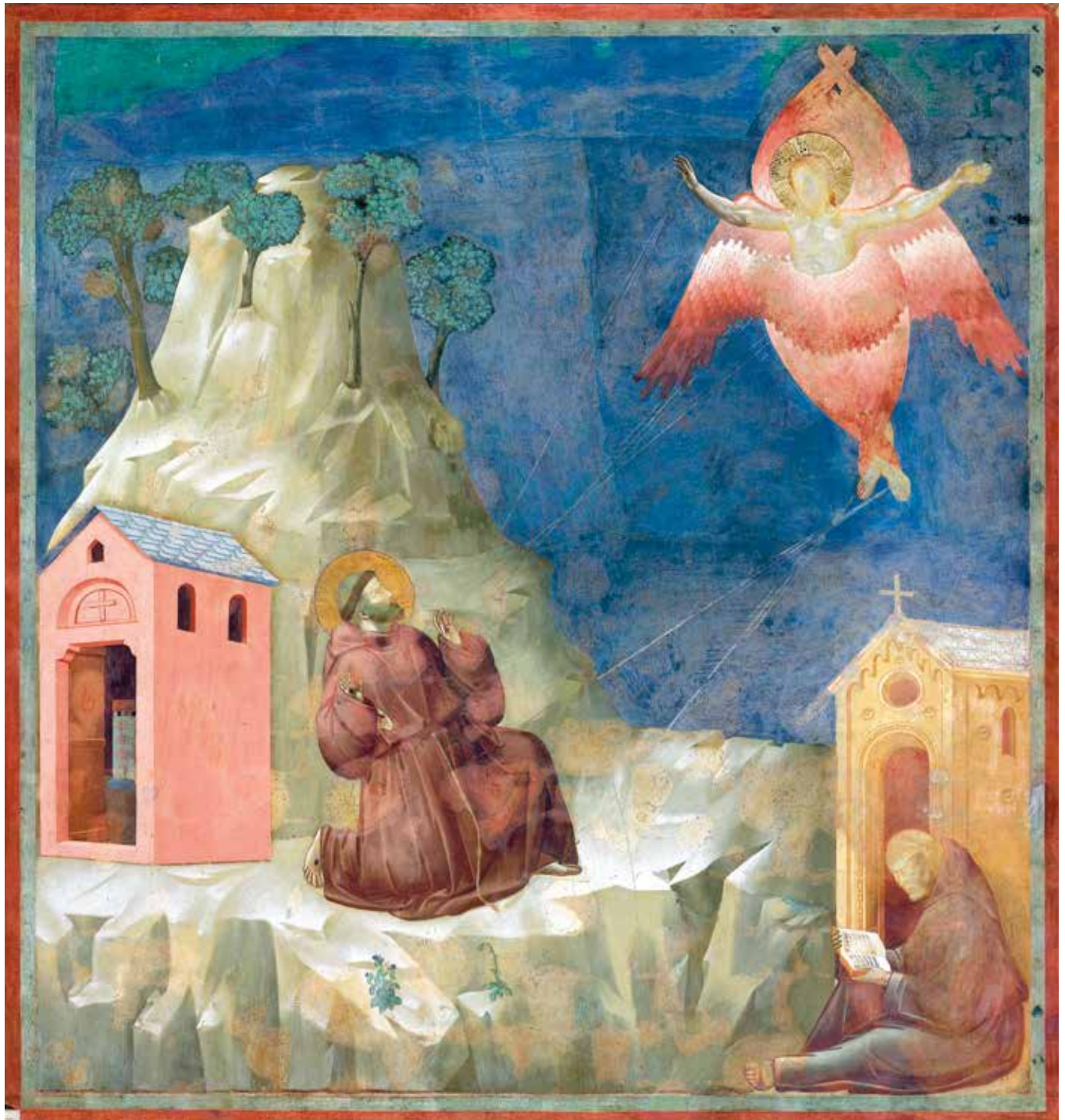
Afb.4 Stigmatisatie van Franciscus, Giotto di Bondone en werkplaats , ca. 1290, fresco, San Francesco (bovenkerk), Assisi.