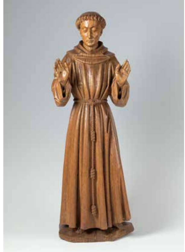
Afb.10 Franciscus als alter Christus, onbekende beeldhouwer uit Utrecht , ca. 1470-1480, eikenhout, 76,5 x 28 x 18 cm, Utrecht, Museum Catharijneconvent, ABM bh599