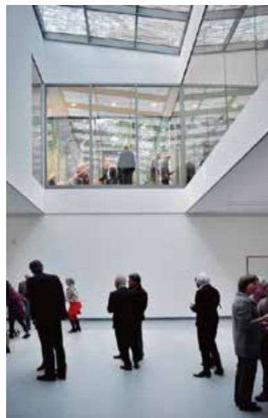
De vide in Kranenburgh, 2013