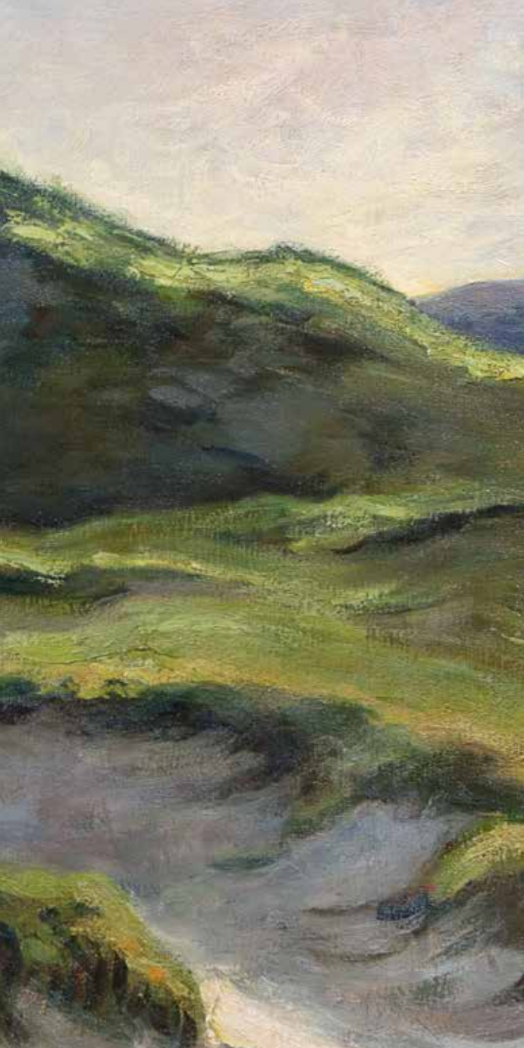
afb. 006 J.M. Graadt van Roggen , Duinlandschap (detail), ca. 1930, 67 x 88 cm, collectie Kranenburgh