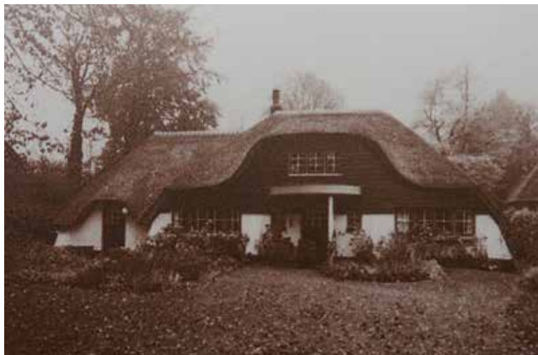
Atelier naar eigen ontwerp van de graficus G.M. Graadt van Roggen, 1916