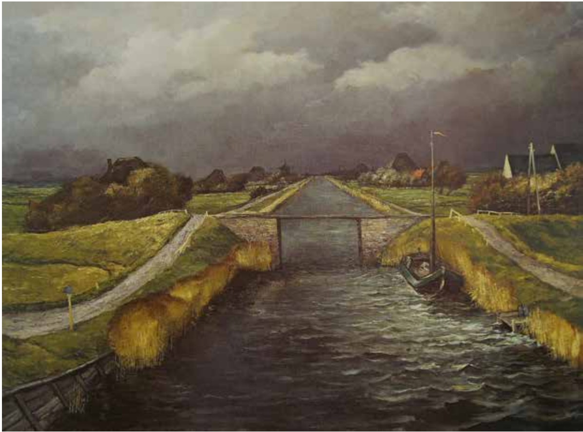
afb. 027 Mattheus Lau , Groote Sloop , 1936, 101 x 130 cm, particuliere collectie