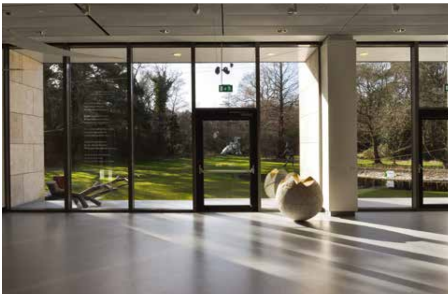
boven Kranenburgh, culturele buitenplaats, 2015 onder Taqazaal in Kranenburgh, 2014