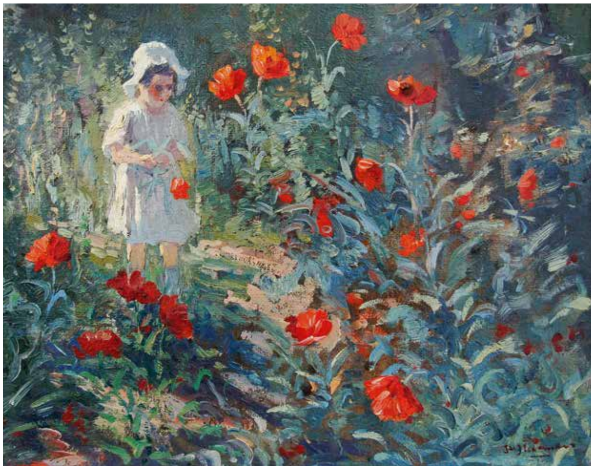
afb. 100 Jac. Koeman , Meisje in bloemenveld , 22 x 28 cm, particuliere collectie