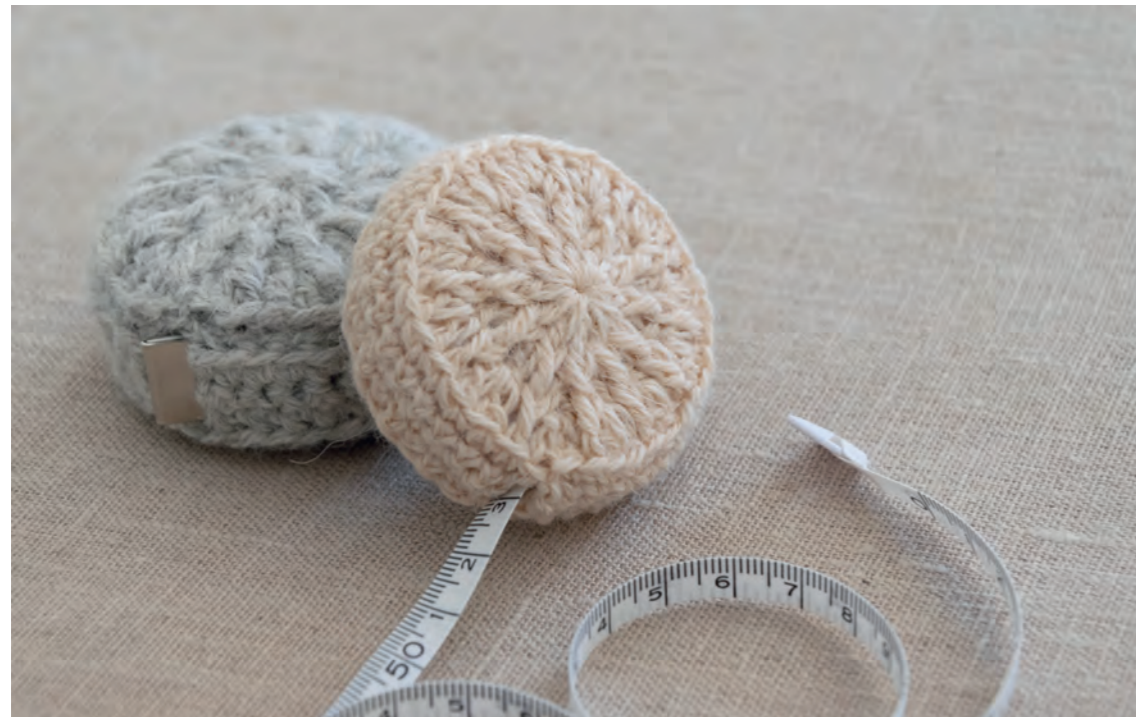
Het patroon van de Measure Mate staat op bladzijde 104.