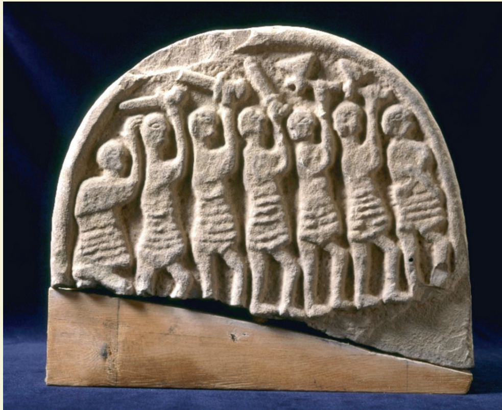
Negende-eeuwse grafsteen uit Lindisfarne. Ook bekend als de Viking Domesday stone. De steen herinnert waarschijnlijk aan de aanslag van de Noormannen op de abdij van Lindisfarne in 793. | English Heritage .