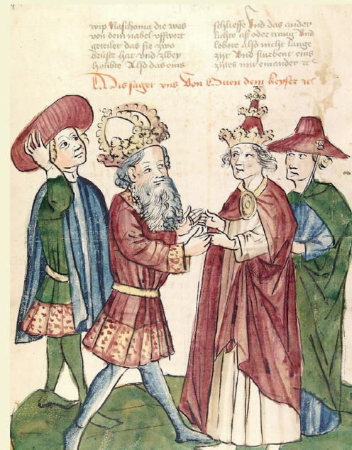
Ontmoeting van Otto I met paus Johannes XII, die hem tot keizer kroonde. | Atelier Diebold Lauber, Hagenau, circa 1450.

Een periode van neergang, buitensporig geweld en miserie: vanouds noemt men zo'n tijd wel een 'ijzeren eeuw' of saeculum ferorum . Het dieptepunt van de Vikingperiode in West-Europa, tussen ongeveer 850 en 965 is sinds de vijftiende eeuw (Lorenzo Valla) ook als zodanig aangeduid, maar omstreeks 750 voor Christus muntte Hesiodus deze term al in zijn Werken en Dagen . De ijzeren eeuw waarin hij leefde zag hij als een dieptepunt, volgend op het gouden, zilveren, bronzen en heldentijdperk. De ijzeren Vikingeeuwen, met het uiteenvallen van het Karolingische rijk, eindigden met de regeerperiode van de Duitse koning Otto I, keizer vanaf 962. Latere perioden zijn eveneens als 'ijzeren eeuw' aangeduid. Bijvoorbeeld de negentiende eeuw, maar hier gold het adjectief 'ijzeren' als aanduiding van de zo onontbeerlijke grondstof ijzer gedurende de industriële revolutie.