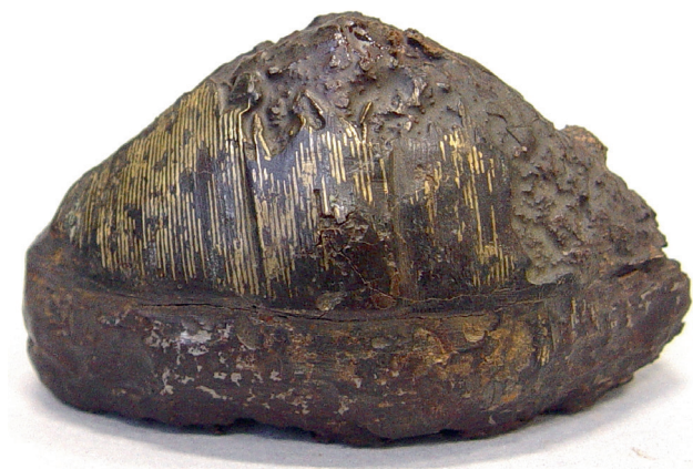
Zwaardknop (pommel) van een Vikingzwaard (messing, ijzer, inleg met zilver). Vóór 900, gevonden aan het strand van Westhove (Oostkapelle/Domburg), bij de toenmalige nederzetting Walcheren.

Ook Witla aan de Maasmond moest het ontgelden. Iets meer naar het zuiden smaakte men eveneens al vroeg de plunderzucht van de Vikingen. Antwerpen brandden ze plat in 836; ook Gent, de Rupel- en Maasstreek, Doornik, Kortrijk en Leuven werden uitgeplunderd.