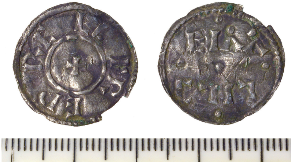
Zilveren penning; vikingimitatie van een munt van Alfred de Grote, circa 880-899.

litieke en dynastieke achtergrond hadden. Bij dit aspect van overbevolking zetten veel historici vraagtekens. Zeer belangrijk was in elk geval de drijfveer van de op krijgseer, trouw en wraak gestoelde cultuur (zie ook Heidense en christelijke strijders en de dood na HOOFDSTUK 8) en het feit dat de oudste zoon in veel streken enig erfgenaam was: dit leverde een overschot op van berooide en op avontuur beluste jongere zonen.