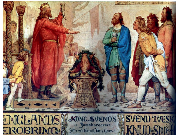
De verovering van Engeland door Sven Vorkbaard (1013). | Historische illustratie van Lorenz Frølich, 1883-1886.

In zeker opzicht weerspiegelde zich zelfs het patroon van de oude Volksverhuizingen: denk aan de door de zeventiende-eeuwse historicus Beda beschreven Britse koning Vortigern, die omstreeks 430 de Saksen te hulp riep in de