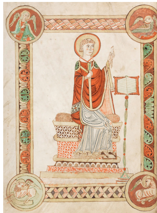
Beda (672/3-735) aan het werk met zijn kerkgeschiedenis van het Engelse volk. | Geïllustreerd handschrift, 1143-1178. Kloosterbibliotheek Engelberg (Zwitserland).