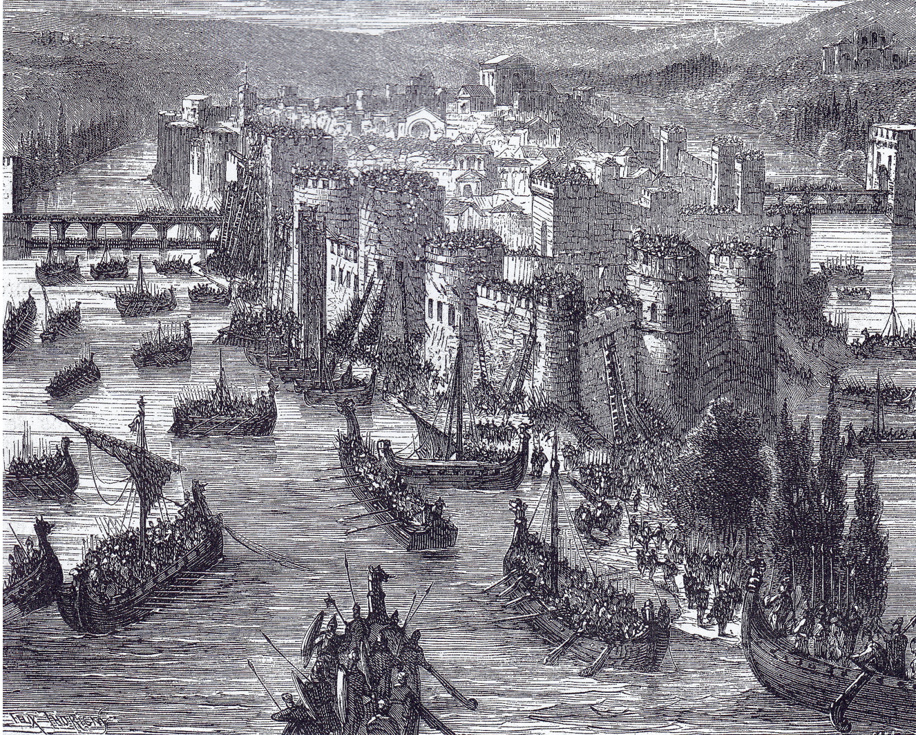
Een Vikingvloot belaagt Parijs in 845. | Negentiende-eeuwse historische prent, maker onbekend.

William van Malmesbury, een Engels geestelijke en historicus in de eerste helft van de twaalfde eeuw, noemde de Denen – weliswaar terugkijkend – onmenselijk wreed en de Noren zeer wellustig. Een Ierse bron schildert de Noren af als lieden met heldenmoed en verschrikkelijk in de strijd, maar noemt de Denen verachtelijk en van lage geboorte.