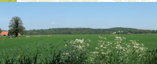
De Lochemse bergen rijzen op uit het landschap.

IJstijden hadden al duizenden jaren eerder voor de nodige grondverschuivingen gezorgd, zodat de stad aan de ene kant door 'Bergen' en aan de andere kant door de Berkel werd ingesloten.