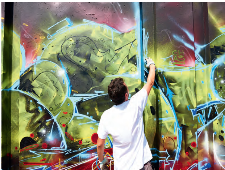
Berenkuil, EMoves, June 2015