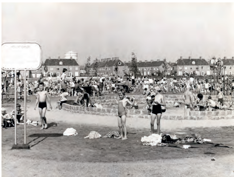
St. Bonifatiuslaan playpark, 1959