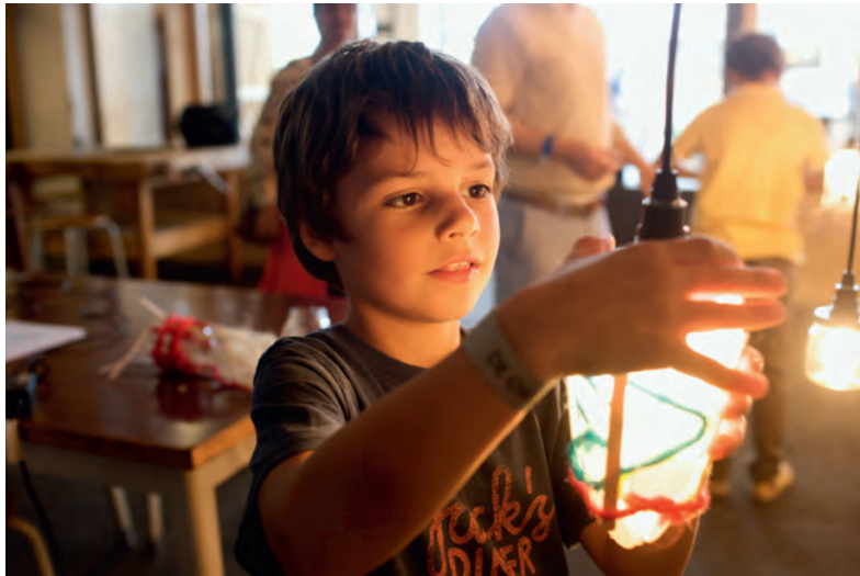
De Ontdekfabriek, Strijp-S, Dutch Design Week, October 2014