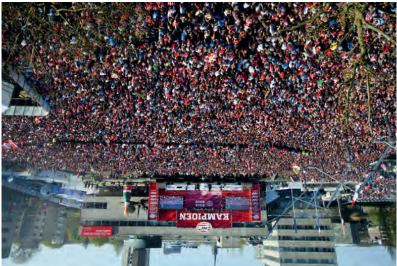
Stadhuysplein, PSV National Champions 2015