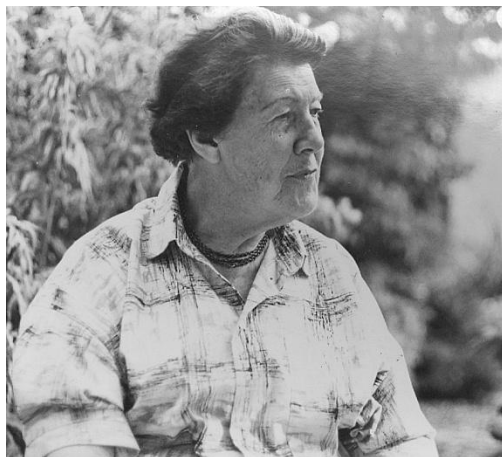
Mama, de latere ‘omi’ die elke zondagavond voor de hele familie kookte.