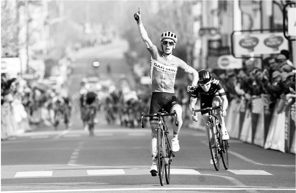
Tom-Jelte Slagter wint op 12 maart 2014 in de 4e etappe van Parijs-Nice de sprint van Geraint Thomas. In de achtergrond wint Wilco Kelderman de sprint van het peloton.

opleidingsploeg een rit in het Circuit des Ardennais, een klimcriterium in Zweden, de Hel van Voerendaal en het Nederlands kampioenschap bij de elite tot 23 jaar. Prachtige resultaten die voor de leiding van het A-team van Rabobank voldoende overtuigend waren om Tom in te lijven. Als beloning voor het vertrouwen werd hij in 2010 vierde in de Tour de l'Avenir. Zijn ontwikkeling verliep razendsnel en velen zagen vooral mogelijkheden voor hem als klimmer, maar die indruk wil Tom enigszins nuanceren. "Ik ben een heuvelklimmer met een goede sprint in de benen. Heuvels tot aan het middengebergte kan ik goed aan, maar daarboven moet ik echt passen ten aanzien van de echte klimmers. De Ardennenklassiekers liggen me goed en bij zware aankomsten heb ik het voordeel dat ik er dan nog een sprintje uit kan persen. In de kleine etappekoersen kan ik voor het klassement rijden, maar in de grote ronden kom ik tekort. Ze liggen me wel, maar voor dagsuccessen en niet voor het klassement. Ik ambieer het wel om in de Tour, Giro of Vuelta nog eens bij de eersten tien te rijden, maar dan moet het routeschema op mijn lijf geschreven zijn en moet ik nog sterker en taaier worden om in de tijdronden en in de lange beklimmingen met de besten mee te kunnen. Dat zal wel ten koste gaan van mijn presteren in de Ardennenklassiekers en daarom geef ik die voorlopig prioriteit. De Waalse Pijl of Luik-Bastenaken-Luik staat op je erelijst toch mooier dan een achtste plaats in de eindstand van de Vuelta."