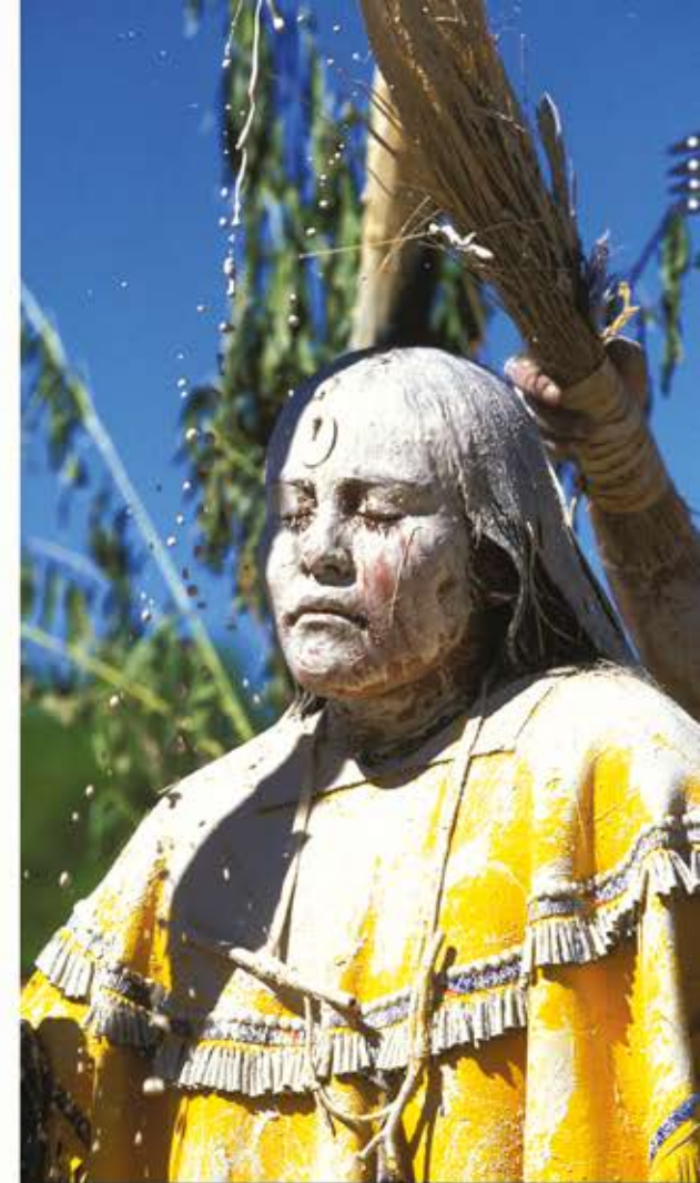
Dit Apache -meisje doet mee aan de Zonsopkomstdans. Ze is beschilderd met heilige klei en maïsmeel.

De gemeenschap zingt liederen over de Veranderende Vrouw uit het scheppingsverhaal van de Apache . Het meisje danst op de liederen. Daarbij stapt ze voorzichtig van de ene voet op de andere. Dit ritueel geeft haar de lichamelijke en spirituele kracht van de Veranderende Vrouw. Ze oefent ook dingen die ze als volwassene nodig zal hebben.