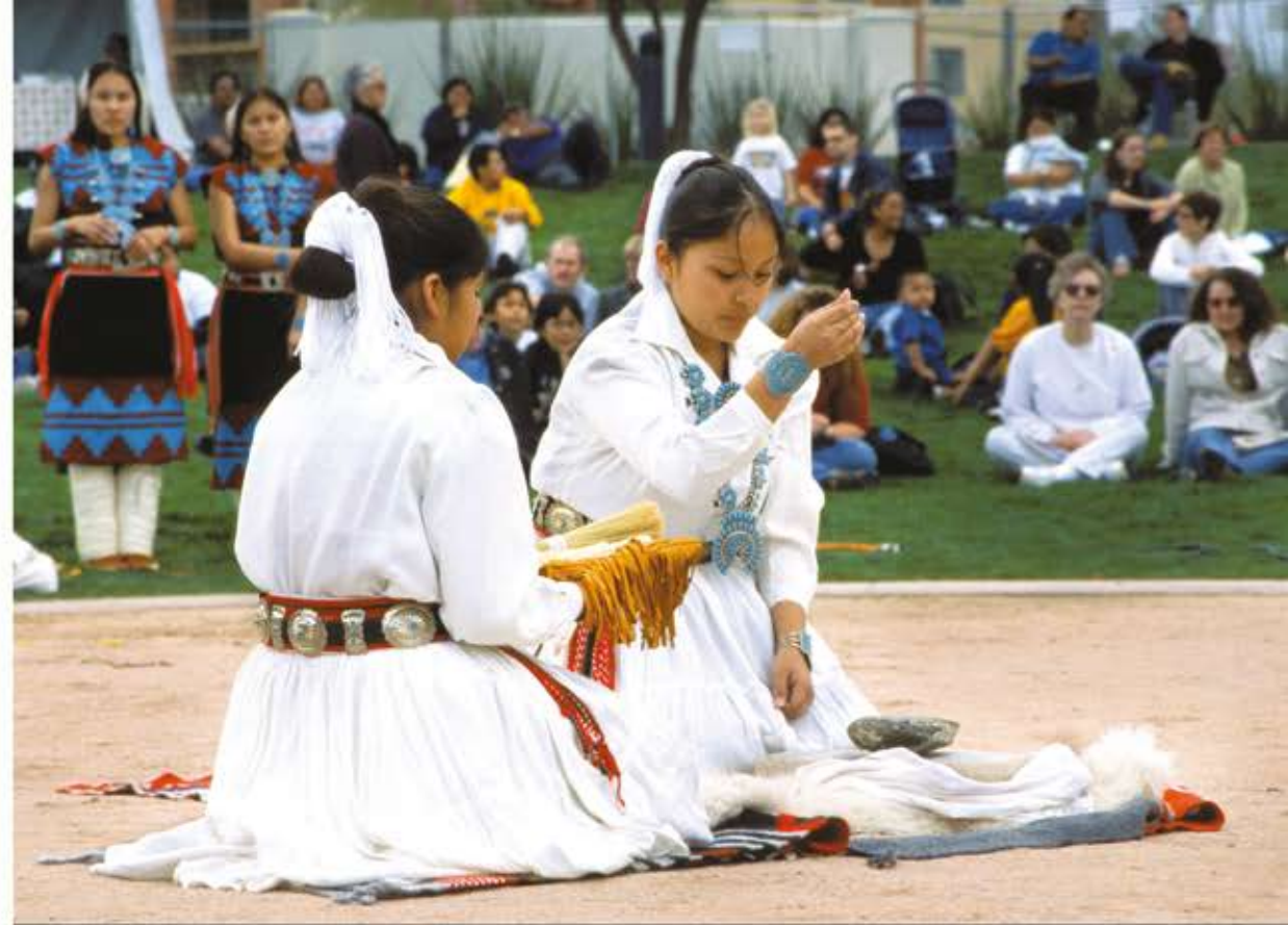
Deze Navajo -meisjes laten zien hoe maïs traditioneel moet vermalen. Ze gebruiken speciale stenen: de mano en metate .

Oostelijke indianen en bosindianen verbouwden maïs, pompoenen en bonen. Deze drie gewassen waren heel belangrijk voor hun voeding. De Irokezen en Wampanoag noemden ze deze groenten 'Drie Zussen' omdat ze goed naast elkaar groeiden en vaak samen werden gegeten in het gerecht succotash .