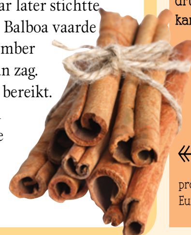
← Kaneel was een van de kostbaarste producten voor de Europese handelaars.

Tot dan toe waren de Amerikaanse nederzettingen kleinschalig. Al gauw echter zouden meer ambitieuze ontdekkingsreizigers Mexico en Peru innemen. Ze luidden daarmee de eeuw van de conquistadores, de veroveraars, in.