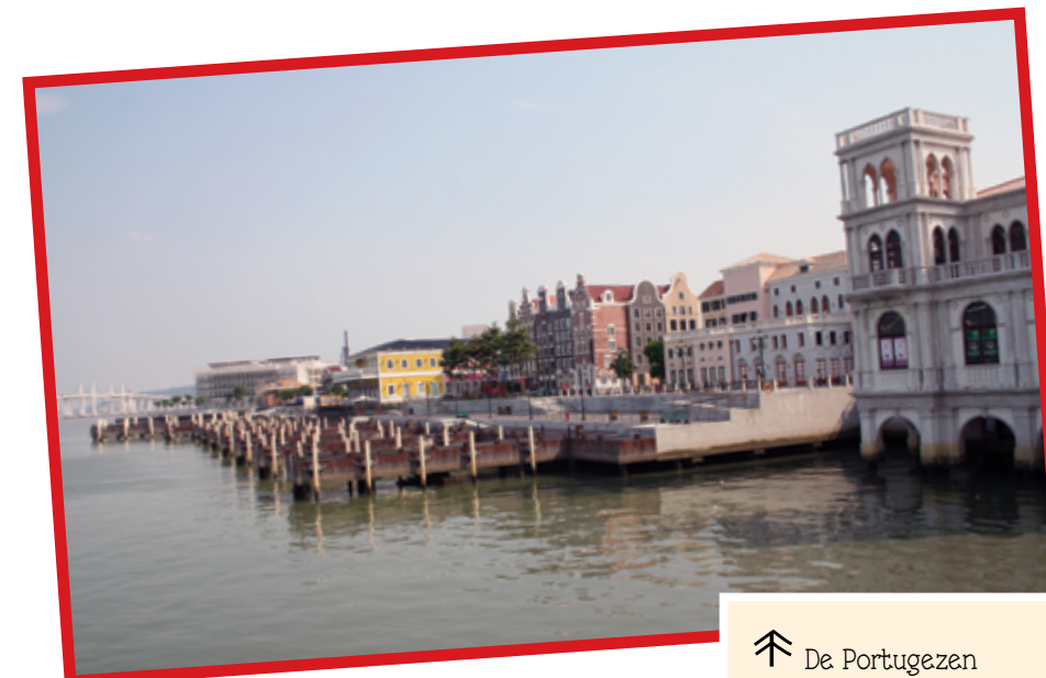
↑ De Portugezen bouwden deze kade voor hun kolonie in Macao in het zuiden van China.

In Europa gebruikte men graag specerijen om het voedsel meer smaak te geven. De belangrijkste handelsplaats ervan in Europa was Venetië. De wens om direct toegang tot specerijen te krijgen, leidde tot de ontdekkingsreizen in de zestiende eeuw. De Portugezen verscheepten peper uit India, kaneel uit Sri Lanka, nootmuskaat en kruidnagels uit de Molukken, en gember uit China. Om de kosten te drukken vestigden zij hun kantoren in Antwerpen en Amsterdam. Rond 1530 was Antwerpen de rijkste stad van Europa.