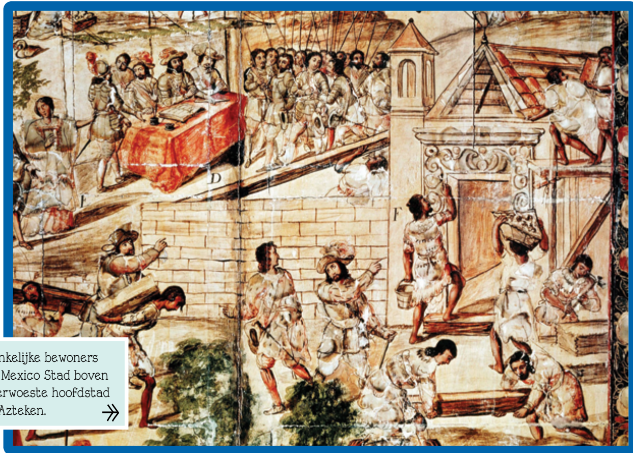
Oorspronkelijke bewoners bouwen Mexico Stad boven op de verwoeste hoofdstad van de Azteken. →

Nadat de Europeanen de Nieuwe Wereld ontdekten, gingen grote aantallen Spaanse soldaten en gelukzoekers de Atlantische Oceaan over, op zoek naar goud en roem.