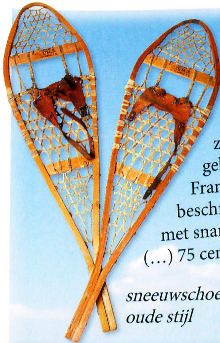
sneeuwschoenen oude stijl

Skiën en snowboarden kun je ook dicht bij huis leren, op een indoor- of outdoorskibaan (of borstelbaan). De vroegste banen waren van borstels gemaakt. De ski's gleden eroverheen en je kon je afzetten als je wilde draaien. Op de banen van nu ligt iets wat eruitziet als sneeuw. Daarop voel je beter hoe het is om op sneeuw te skiën.