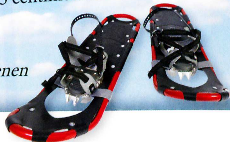
sneeuwschoenen nieuwe stijl