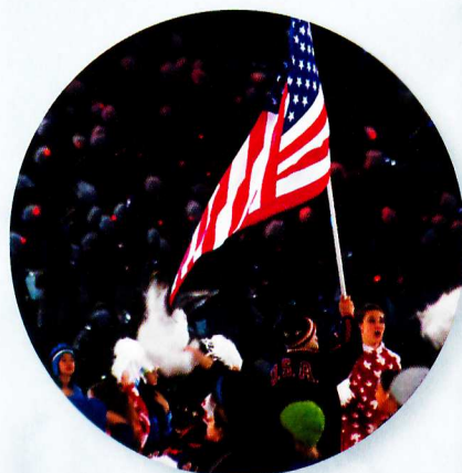
Heath Galloun met de Amerikaanse vlag bij de Paralympische Winterspelen van 2010.

Ook gehandicapten kunnen skiën. Heath Calhoun was soldaat van het Amerikaanse leger in Irak. Bij een aanval werd zijn jeep getroffen door een raket. Zijn benen waren ernstig verwond en moesten boven de knie worden afgezet. Toen hij was hersteld, wilde hij leren skiën. Vier jaar later deed hij mee met de Paralympische Winterspelen van 2010 .