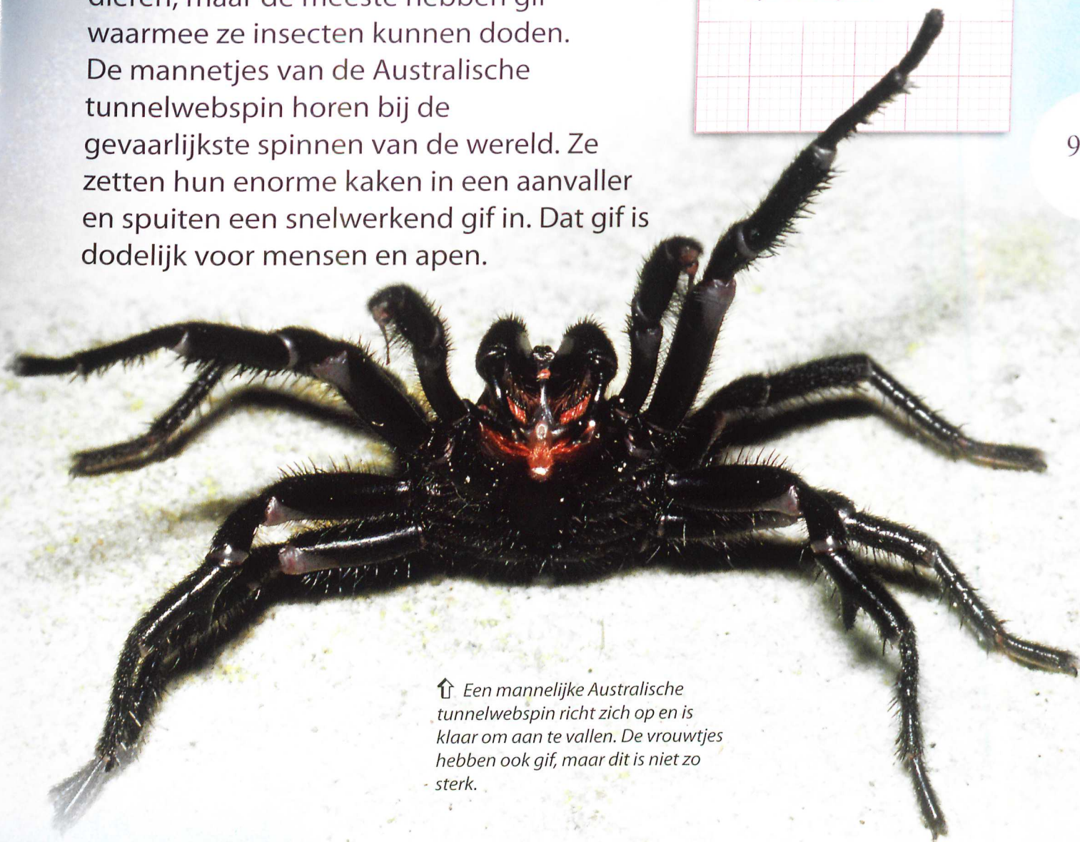
↑ Een mannelijke Australische tunnelwebspin richt zich op en is klaar om aan te vallen. De vrouwtjes hebben ook gif, maar dit is niet zo sterk.

Spinnen zien er niet uit als sterke dieren, maar de meeste hebben gif waarmee ze insecten kunnen doden. De mannetjes van de Australische tunnelwebspin horen bij de gevaarlijkste spinnen van de wereld. Ze zetten hun enorme kaken in een aanvallende en spuiten een snelwerkend gif in. Dat gif is dodelijk voor mensen en apen.