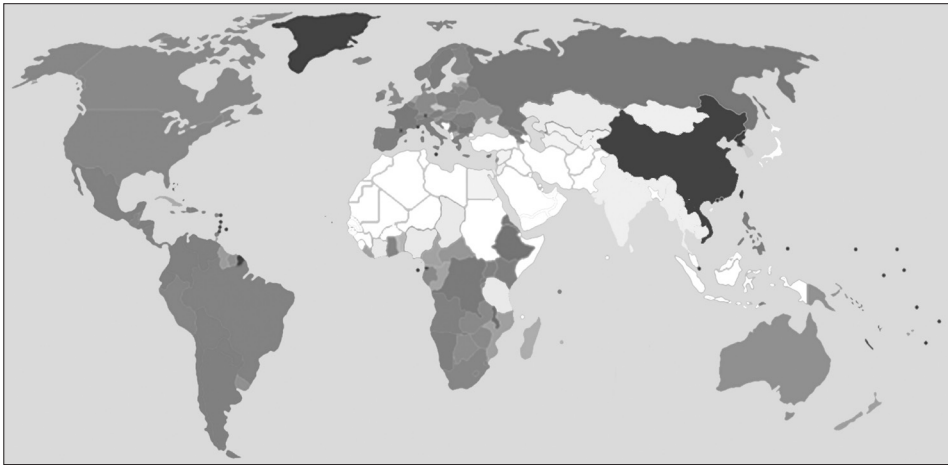
Verspreiding islam (lichtgekleurd) en christendom (grijsgekleurd) op de wereld.

Het kaartje hieronder toont de verspreiding van de top 2 geloven over de wereld. Vijftig procent van de wereldbevolking is aanhanger van of het christendom of de islam, maar de derde (en snelst groeiende) groep is 'niet-religieus'. Vijfenzeventig procent van de wereldbevolking 'gelooft' in de top 5, daarna komen er alleen nog heel veel kleine splintergeloven.