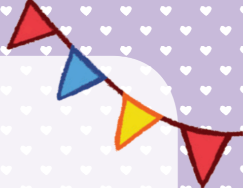
foto van mijn eerste verjaardag