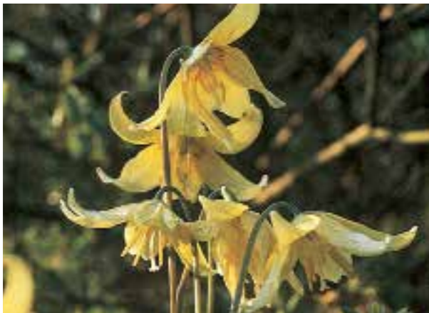
Erythronium 'Pagoda' ♣ Lage, polvormende vaste plant voor de schaduw (zie pag. 295)