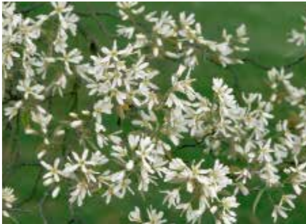
Amelanchier lamarckii ♣ Heesterachtige boom met jong, bruinroze blad (zie pag. 277)