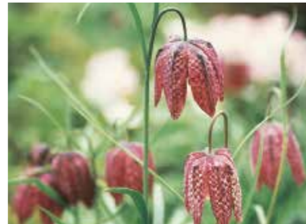
Fritillaria meleagris De kievitsbloem is een laag bolgewasje dat verwildert in gras (zie pag. 298)