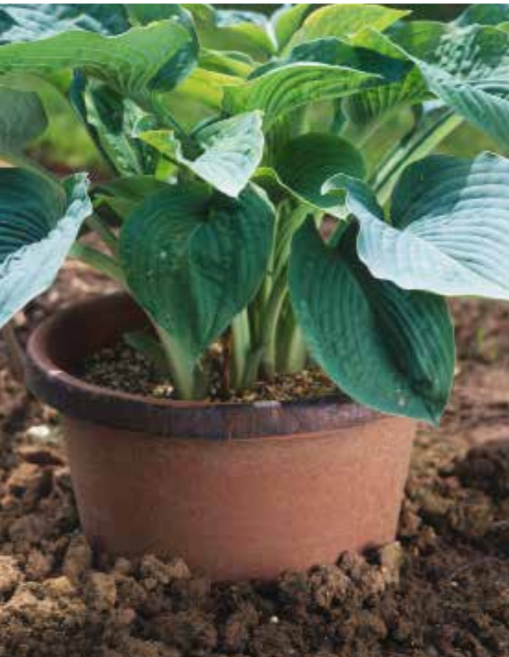
Slakken en hosta's Slakken kunnen een hostaliefhebber tot wanhoop drijven.

Blijf de borders onkruidvrij houden , maar spaar de zelf uitgezaaide zaailingen. Je zult verbaasd staan hoeveel je er vindt. Veel hybriden en ook veel cultivars komen niet soortecht op uit zaad, maar de zaailingen kunnen allerlei variaties opleveren in bloemkleur, groeiwijze en zelfs bladkleur.