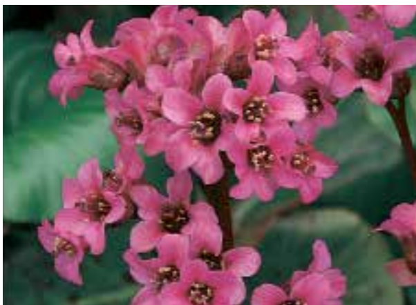
Bergenia 'Sunningdale' Stekelige heester waarvan de bloemen in de herfst gevolgd worden door blauwzwarte vruchten (zie pag. 280)