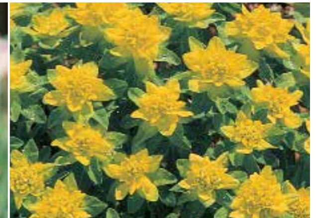
Euphorbia polychroma ♣ Mooie, polvormende vaste plant die in de halfschaduw opvalt (zie pag. 296)