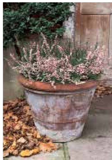
Ruim rommel op Laat bladeren niet zomaar in de buurt van planten of potten liggen.

■ Zet potten met vorstgevoelige planten binnen , als dit tenminste nog niet was gebeurd. Er zal in de maand december nog niet zoveel slecht weer op komst zijn, maar voor bepaalde planten kan een nachtvorstje al fataal zijn. Zet de planten in een onverwarmde of koude kas of serre. Ze zullen om te overwinteren maar weinig warmte nodig hebben, maar moeten wel vorstvrij gehouden worden. Geef de planten net genoeg water om in leven te blijven, maar vooral niet te veel. Zorg zoveel mogelijk voor een goede luchtcirculatie rond de planten door, zodra het weer het toelaat, de luchtramen open te zetten. Door vochtige, stilstaande lucht krijgen schimmelziekten meer kans.