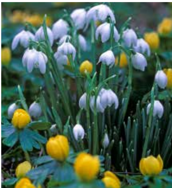
Een prachtig gezicht Parelachtige sneeuwkllokjes en een goude winterakoniet zijn in januari de perfecte partners in je tuin.

Minder inspannend is een wandelingetje door de tuin en dat kan ook in januari heel verrassend zijn doordat je ineens sneeuwkllokjes vindt of een groep gele winterakonieten die bijna bloeien. Wat ook niet mag ontbreken is de kerstroos, Helleborus niger , die ondanks