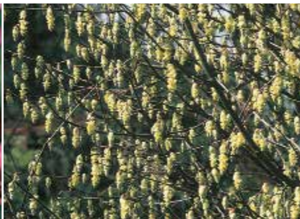
Corylopsis glabrescens Grote, bladverliezende heester voor zure grond (zie pag. 289)