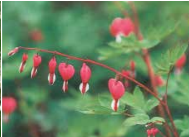
Dicentra spectabilis ♣ Hoge, overhangende vaste plant met mooi blad (zie pag. 293)