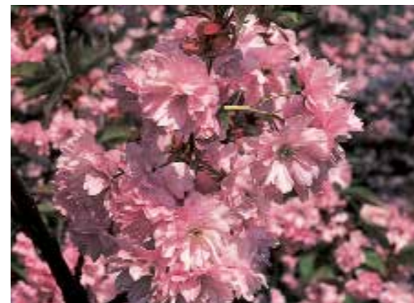
Prunus 'Kanzan' ♣ Dieproze bloemen in grote trossen. (zie pag. 320)