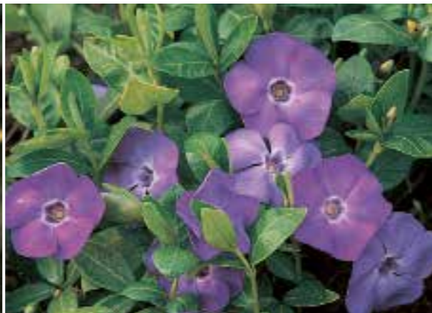
Vinca minor De stengels zijn in voorjaar en zomer overdekt met bloemen (zie pag. 335)