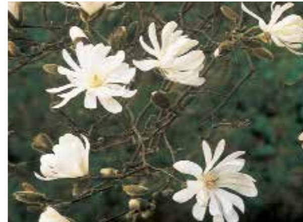
Magnolia stellata ♣ Compacte, 3 m hoge heester, geschikt voor een kleine tuin (zie pag. 309)