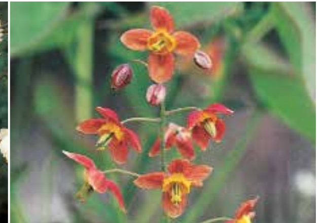
Epimedium x warleyense Polvormende vaste plant, geschikt als bodembedekker (zie pag. 294)