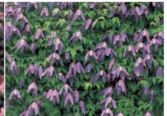
Clematis alpina 'Frances Rivis' ♣ Klimplant met klokvormige bloemen. Alleen snoeien indien nodig (zie pag. 285)