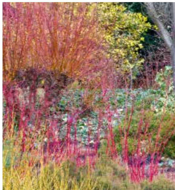
Een gemengde winterborder Deze prachtige foto toont Prunus davidiana 'Alba', Erica carnea , Cornus alba 'Sibirica', Cornus sericea 'Flaviramea', Salix alba 'Chermesina', Erica erigena 'Brightness' en Carex montana .