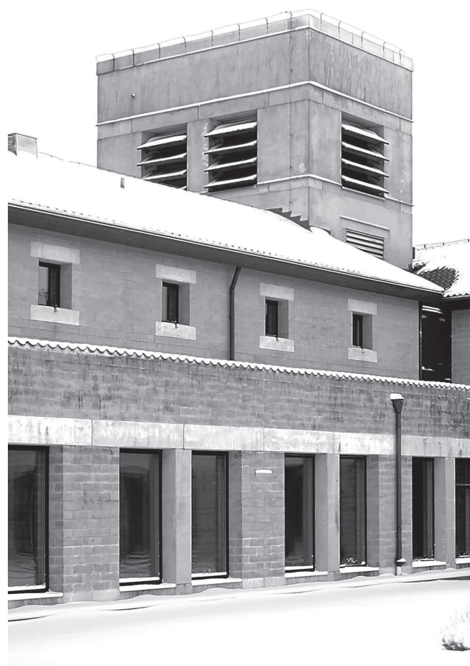
hof van de zusters in Mariavall