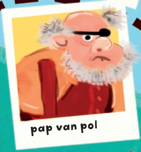
pap van pol