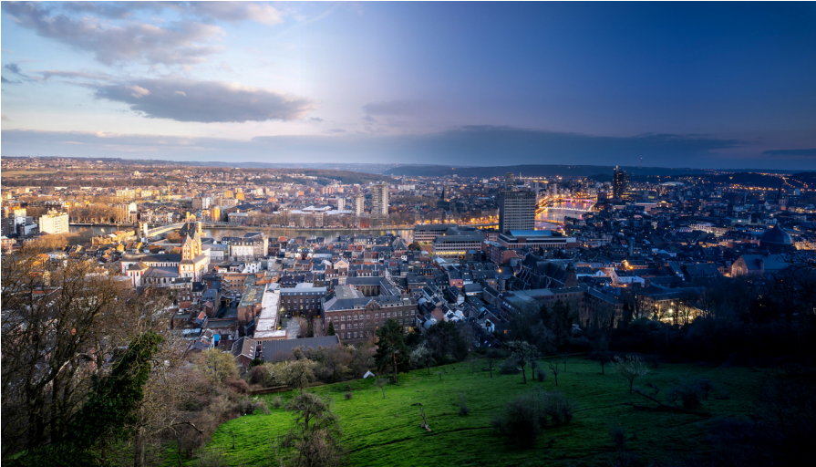
Skyline van de stad Luik.

Voor de naam van de stad bestaan meerdere mogelijke verklaringen. Vaak wordt verwezen naar het Germaanse woord 'liudz', dat staat voor mensen of volk. Bekijk je het geografisch, dan duikt 'Legia' op, een riviertje dat in Aartselaar ontspringt en na vijf kilometer in de Maas uitmondt ter hoogte van de huidige Quai de la Ribuée. Daar zou de stad mogelijk ontstaan zijn.