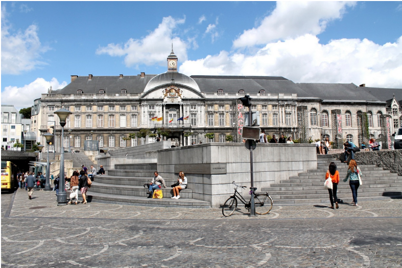
Place Saint-Lambert, het kloppend hart van de stad.

Een rijke geschiedenis waarin prins-bisschoppen een belangrijke rol speelden maar het volk niet met zich liet sollen, talloze monumenten en beeldhouwwerken in het straatbeeld, gebeurtenissen die de geschiedenis van de stad bepaalden, de Maas als leidraad voor planologen en stedelingen, het uitermate gediversifieerde horeca-aanbod... Dat allemaal bundelen in vier wandelingen dwingt noodgedwongen tot selectie maar ook tot bochtenwerk.