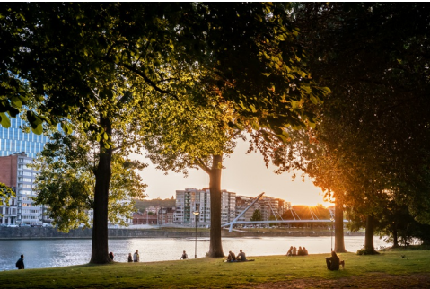
Parc Boverie