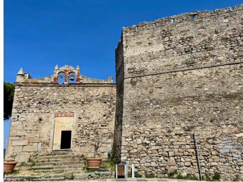
San Nicola kerk in San Piero in Campo