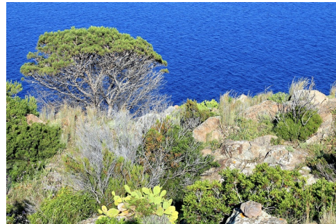
Op Montecristo staat de natuur altijd voorop

Montecristo mag pas sinds kort worden bezocht, onder begeleiding van een parkgids. Dit geldt echter voor een beperkt aantal bezoekers per jaar, dus een aanvraag voor een vergunning moet je lang van tevoren indienen. Als het je lukt een plek op de lijst te bemachtigen, dan maak je een begeleide dagtocht naar het eiland. Tijdens de wandeltocht (2 uur) beklim je de rots en zie je overblijfselen van het Romeinse Jupiteraltaar, het 13de-eeuwse klooster en van de nog oudere abdij. De San Mamilianogrot , waar de heilige zou hebben verbleven, is ook nog steeds zichtbaar. Je kunt er ex-voto's zien die pelgrims en matrozen er door de jaren heen hebben achtergelaten.