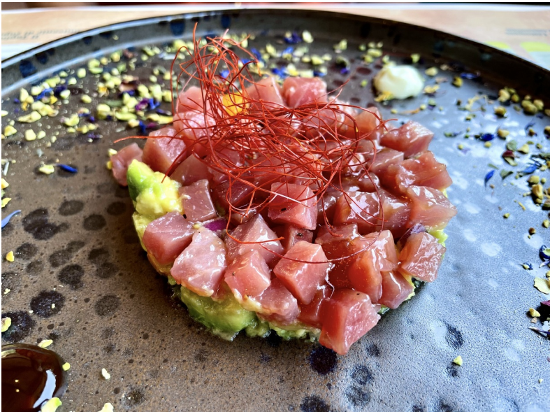
Een taartje met tonijn, avocado en saffraan

De alomt gewaardeerde Toscaanse cucina povera heeft op Elba een interessante twist gekregen met typische gerechten uit de keuken van mijnwerkers en steenhouwers. De term cucina povera ('arme keuken') verwijst naar het feit dat de gerechten ontstaan zijn uit armoede, waarbij efficiënt gebruikge- maakt wordt van restjes. Vanwege de ligging aan zee zijn gerechten met schelpdieren en vis overvloedig op de Toscaanse eilanden. Zie ook: 'Op de Elbaanse menukaart' in het onderdeel 'Een mondje Italiaans'.