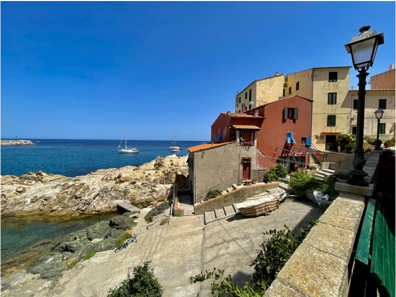
Het haventje van Cottone in Marciana Marina

Elba is verreweg het grootste en bekendste eiland van de Toscaanse Archipel, in een boog daaromheen liggen van noord naar zuid de eilanden Gorgona, Capraia, Pianosa, Montecristo, Giglio en Giannutri. Dan zijn er nog talloze onbewoonde eilanden en rotseilandjes, die zo klein zijn dat ze formiche (mieren) worden genoemd. In 1996 werden ze met elkaar verenigd door de oprichting van het Nationaal Park van de Toscaanse Archipel dat de zee, de koraalriffen, de buitengewone biodiversiteit en de landschappen van de eilanden moet beschermen. Met een totale oppervlakte van ongeveer 180 km 2 land en 61 km 2 zee vormt dit het grootste beschermde maritieme natuurpark in Europa. Alle eilanden hebben duurzaamheid dan ook hoog in het vaandel staan.