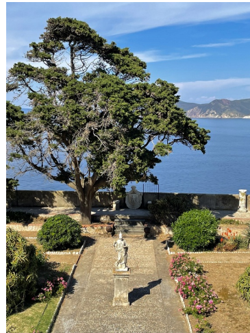
Tuin van Palazzina dei Mulini, Napoleons stadspaleis