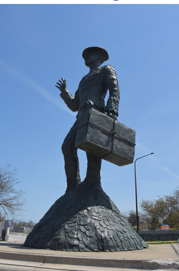
Monument to the Great Northern Migration van Alison Saar in Bronzeville.

In 1914 was 75% van de inwoners van Chicago geboren buiten de stad en voornamelijk afkomstig uit Oost-Europa, Ierland en Duitsland. De groei van de werkgelegenheid tijdens de Eerste Wereldoorlog trok veel Afro-Amerikanen uit het Zuiden van de Verenigde Staten. Ongeveer 70.000 mensen arriveerden tussen 1915 en 1920. Niet alleen het gebrek aan werk door een verregaande mechanisatie van de traditionele katoenindustrie maar ook een toenemend (institutioneel) racisme in de Zuidelijke Staten leidde tot een forse migratie van de zwarte bevolking. De zogenaamde Jim Crow -wetten in de Zuidelijke Staten legitimeerden een rassenscheiding in alle publieke instellingen, zoals scholen, theaters, parken, bussen, bibliotheken en zwembaden, en leidden tot verregaande segregatie. De Illinois spoorlijn zorgde voor een snelle en goedkope verbinding van de steden in het Zuiden met Chicago en de nieuwkomers stroomden binnen aan de zuidkant van de stad, de South Side . De vele tienduizenden Afro-Amerikanen vonden werk in de fabrieken van Chicago en trokken massaal in de toch al benauwde woningen van familie of vrienden die hen vooruit waren gegaan. Het was de enige wijk waar ze mochten wonen. Al snel kreeg deze buurt in de South Side de naam Bronzeville (zie