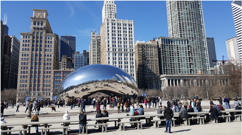
Cloud Gate in Millennium Park

Chicago ligt in de staat Illinois aan de westelijke oever van Lake Michigan. Met bijna 3 miljoen inwoners is het na New York en Los Angeles de derde stad van de Verenigde Staten. Chicago is startpunt van Route 66 en staat bekend als 'windy city', hoofdstad van de blues en centrum van architectuur. Wie kent niet de iconische art-deco gebouwen of het huidige symbool van de stad: Cloud Gate, in de volksmond The Bean. Chicago is ook de stad van Oprah Winfrey, Michelle Obama en de Bulls (basketbal) en staat met wolkenkrabbers als de Willis Tower, Trump Tower, en John Hancock Tower in de top 10 van Amerika's hoogste gebouwen.