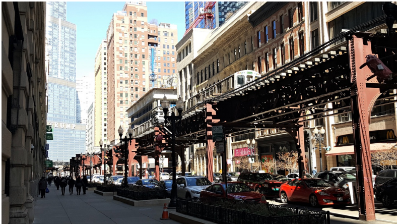
L-train in The Loop

Chicago groeide razendsnel tot twee miljoen inwoners in 1907, maar het was geen prettige woonstad door drukte, vervuiling en stank van de slachterijen en fabrieken in het centrum. Daarnaast leken allerlei modernisering, zoals het vervangen van de paardentrams door elektrisch aangedreven modellen en de eerste verhoogde ( eLevated ) spoorlijnen (L-trains) alleen maar meer chaos en onveilige situaties te veroorzaken.