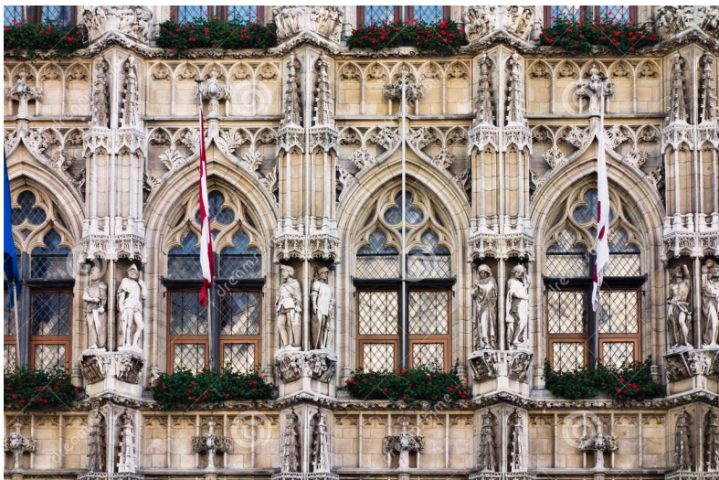
Rijk bewerkte façade van het stadhuis in Leuven.

Vlaams-Brabant is met Waals-Brabant de jongste provincie van België, maar kent wel ondanks haar jonge bestaan een lange geschiedenis. De provincie ontstond op 1 januari 1995 toen de provincie Brabant gesplitst werd in een Nederlandstalig en een Franstalig deel. De grens tussen beide provincies loopt langs de Taalgrens, die werd vastgelegd in de jaren 1961-1963. Leuven werd provinciehoofdstad. Het Brussels Hoofdstedelijk Gewest hoort bij geen van beide provincies en is – opvallend – helemaal omgeven door de provincie Vlaams-Brabant.