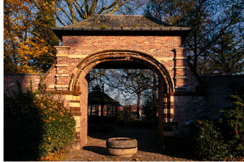
Drossaerdenpoort, Aarschot.

Bewonder het stenen kantwerk van de Sint Leonarduskerk Vakwerkhuisje, nu bij de stadsrand