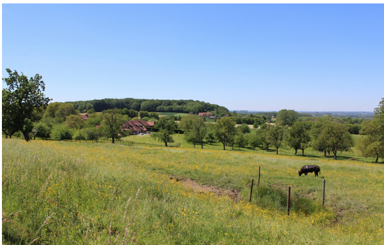
Het heuvelachtige Pajottenland.

Herkenbare toeristische regio's zijn een eenvoudige wijze om een provincie in te delen, ook landschappelijk. Soms zijn de onderlinge grenzen wat onduidelijk en lopen de landschappen in elkaar over. Onderstaande indeling, van oost naar west, lijkt de meest herkenbare.