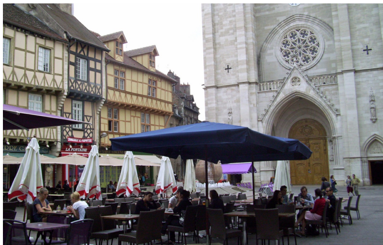
Het sfeervolle Place St-Vincent in Chalon-sur-Saône

De Chalonnais, in het noorden van de Saône-et-Loire, kent een afwisselend landschap met bossen, landbouw en wijngaarden. De streek ligt in het dal van de Saône en grenst aan de weidse vlakte van de Bresse in het oosten. Ten westen van de Saône liggen de kalkstenen wijnhellingen van de Côte chalonnaise. De wijnen uit dit district, zoals de Bouzeron, Rully, Mercurey, Givry en Buxy, zijn minder bekend en wat eenvoudiger dan die uit de aangrenzende wijnstreken van de Côte d'Or en de Mâconnais, maar hebben een uitstekende prijs-kwaliteitverhouding. De aanwezigheid van de Voie Verte, de Saône en het Canal du Centre bieden fiets- en vaarmogelijkheden terwijl liefhebbers van kastelen in Rully, Germolles en La Ferté hun hart kunnen ophalen. Chalon-sur-Saône is het dynamische, economische centrum van de Chalonnais en heeft een groot aanbod van culturele activiteiten.