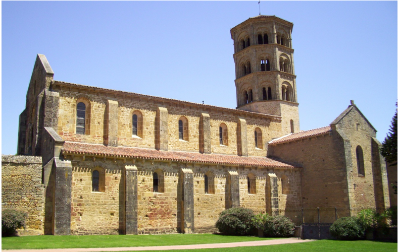
De kerk van Anzy-le-Duc in de Brionnais

Zuid-Bourgondië, ofwel het departement Saône-et-Loire (8575 km 2 , ca. 554.000 inw.) ligt in het zuiden van Bourgondië en is één van de vier departementen die samen deze regio vormen. Zoals de naam al aangeeft, bepalen twee rivieren de ligging: de Saône doorkruist het departement van noord naar zuid en vormt vanaf Tournus de oostgrens, terwijl de Loire het gebied in het zuidwesten afbakt.