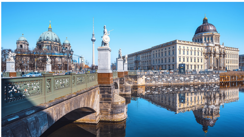
Het nieuwe Stadtschloss: Humboldt Forum.

Deze fietstocht voert dwars door het centrum en is een eerste kennismaking met de Pruisische keizers, de nazi's, het socialisme en het nieuwe Berlijn. De Pruisische keizers lieten Unter den Linden aanleggen om zo snel mogelijk van hun paleis naar hun jachtterrein in de Tiergarten te kunnen rijden. Dat oude slot werd tijdens de Tweede Wereldoorlog aan flarden gebombardeerd, waarna het DDR-regime er zijn eigen pronkstuk, het Palast der Republik, voor in de plaats bouwde. Na de val van de Muur besloot het gemeentebestuur van het nieuwe Berlijn om dat symbool van het mislukte socialisme af te breken en er een replica van het oude barokke stadslot te bouwen – het Humboldt Forum. Alsof er niets gebeurd was.