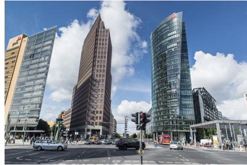
Skyline Potsdamer Platz.

DDR Museum Neue Nationalgalerie Museum der Dinge Sammlung Berggruen Sammlung Hoffmann Jüdisches Museum