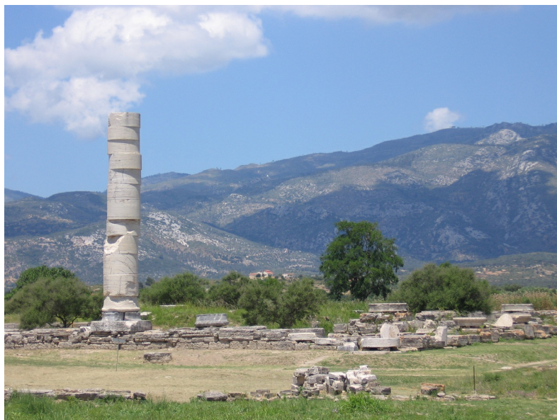
Heraion, het heiligdom gewijd aan de godin Hera.

De eerste sporen van bewoning in het 3de millennium v. Chr. werden bij Heraion (Pithagório) gevonden. Rond 1100 v. Chr. vestigden de Ioniërs zich op het eiland. In de 6de en 5de eeuw v. Chr. was Sámos na Milete de belangrijkste handels- en cultuurstad van het oostelijke Middellandse-Zeegebied.