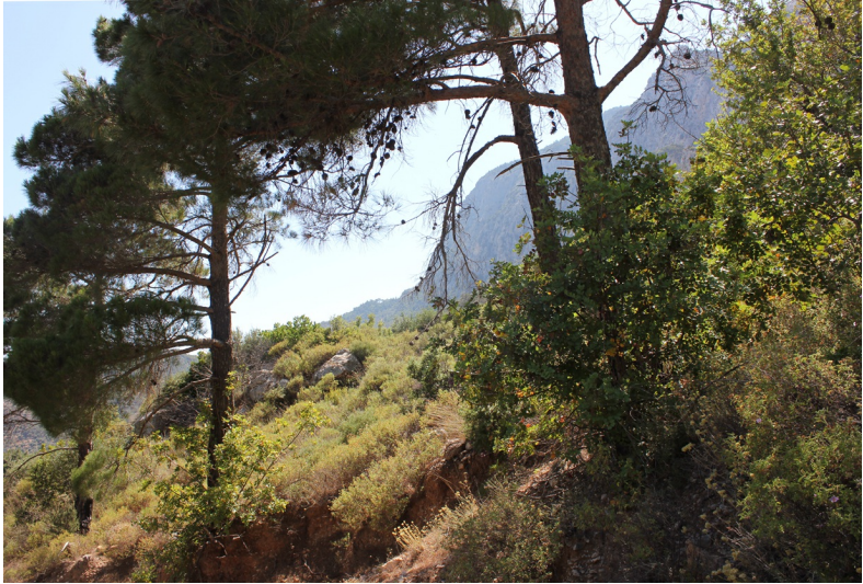
Het woeste binnenland van Sámos.

Het landschap van Sámos wordt door twee bergmassieven bepaald. In het westen rijst het Kerketéfs-gebergte (ook wel Kérkis) op met als hoogste top de Vígla (1433 m). Het gebergte is rijk aan grotten. In het midden ligt het Ámbelosgebergte met de Karvoúni (1153 m) als hoogste top. Tussen de bergketens en de zee strekken zich kleine, vruchtbare vlaktes uit, waarvan de Kámbos Chóras bij Pithagório de grootste is. Het is dan ook niet voor niets dat de luchthaven van het eiland zich daar bevindt. De zeestraat, Stenó Samoú, die het eiland van Turkije scheidt, is op het smalste punt bij Psili Ámos slechts 1200 meter breed.