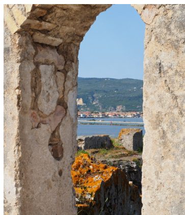
Vesting met zicht op de Lefkادا-stad

De vesting, die deels omgeven wordt door een gracht, moest piraten en Turken schrik aanjagen. De Franken noemden het kasteel Sainte Maure ter herinnering aan hun geboortestreek in het Loiredal. De Venetianen gaven het kasteel en het eiland de naam Santa Maura (Grieks: Άγ. Μάυρα), een naam die ook de Britten gebruikten. In 1479 veroverden de Turken de vesting. De Ottomaanse bezetting duurde meer dan twee eeuwen. Na 1503 werd het kasteel vergroot en aan het einde van de 16de eeuw telde het kasteel zo'n tweehonderd huizen, drie moskeeën, twee hamams en een tiental openbare gebouwen. Tijdens de Ottomaanse bezetting werd het kasteel ook gebruikt als uitvalsbasis voor piraten die koopvaardijshipschen op de Ionische Zee belaagden.