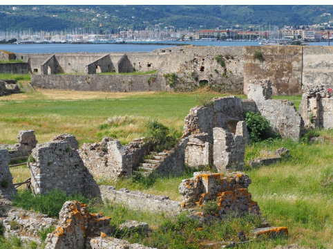
Het binnenterrein van de vesting

Kapitein Francesco Morosini slaagde er in 1684 in om na een beleg van zestien dagen het kasteel te veroveren. De Venetianen verplaatsten de hoofdstad van het eiland naar de huidige locatie. Het kasteel werd gereorganiseerd en omgevormd tot een militair trainingskamp. Na de val van Venetië in 1797 was het kasteel twee jaar in handen van de Fransen. Op 21 maart 1800 werd de vlag van de Republiek der Verenigde Ionische Eilanden op de kasteelmuren gehesen. In 1807 brachten de troepen van Napoleon Lefkáda terug onder het gezag van Frankrijk. De belegering van het kasteel door de Britten