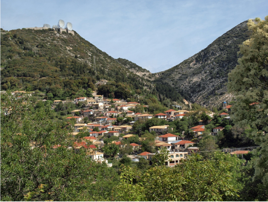
Het landschap rond Eglouví in het binnenland

Lefkáda (Grieks: Λευκάδα of Λευκάς), ook wel Lefkás genoemd, is in grootte het vierde eiland van de Ionische archipel. Hoewel je een vraagteken kunt zetten bij de benaming 'eiland', want Lefkáda is met een dam en een drijvende brug verbonden met het Griekse vasteland. Zo'n driekwart deel van het eiland is bergachtig, waarvan de hoogste toppen net boven de duizend meter reiken, met de Stavrotá (1182 m) als winnaar. Het eiland kent twee grote laagvlaktes: in het noorden rond de hoofdstad Lefkáda en in het zuiden bij Vasilikí, waar de bergen een vruchtbare vallei omarmen.