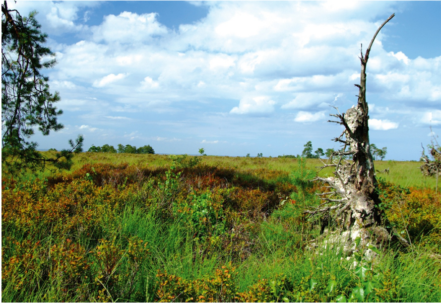
Fagne de Malchamps, bij Spa.

Naargelang de invalshoek die je kiest – geologisch, historisch of toeristisch – heeft de omschrijving van de Ardennen een verschillende invulling. In deze uitgave kiezen we voor de ruimere aanpak, zeg maar de toeristische. We opteren dus niet voor een omschrijving waarbij de grenzen vooral bepaald worden door gesteenten of andere reliëfvormen, maar we laten ook de menselijke inbreng spelen. Het is niet omdat je op de slechts een paar kilometer brede kalksteenformatie van La Calestienne bent dat je reisplezier of vakantiegenot plots met een aantal procenten zou moeten wijzigen.