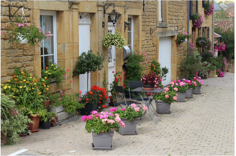
Veel kleur in de mooiste dorpen van Wallonië