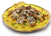
مَنْسَف mansaf lam met rijst (feestmaaltijd bij de bedoeïenen)