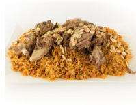
كَبْسَة kabse vlees met rijst met speciaal kruidenmengsel