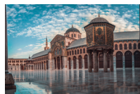
الْمَسْجِدُ الْأُمَوِي al-masjid al-umawi de Omajjadenmoskee in Damascus