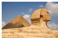
أَبُو الْهَوَل abū al-ḥawl de grote sfinx