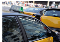
de taxistandplaats مَحْطَةٌ تَاكْسِيٍّ maḥṭat tākṣi