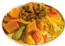
كُسْكُوس kuskus de couscous