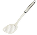
de bakspatel مِلْعَقَةٌ تَقْلِبِ mil'aqat taqlib