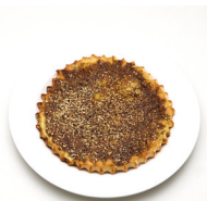
مَنَاقِيشَ زَعْتَر manāqīsh za'tar kleine deegkoeken met tijm en olijfolie