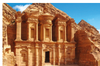
الْبَتْرَاء al-batrā' schatkamer van de farao in de stad Petra