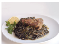
مُلُوخِيَّة mulūkhiya hoofdgerecht van kaasjeskruid en vlees