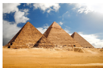
أَهْرَامَات الْجِيزَة ahrāmāt al-jīza de piramiden van Gizeh