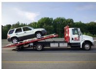
de sleepwagen سَيَّارَةٌ سَحَبَ سَيَّارَاتٍ sayyārat saḥb sayyārat