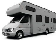
de camper سَيَّارَةٌ مَنْزِلٍ مُتَنَقِّلٌ sayyārat manzil mūtanaqqil