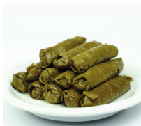
يَلَنْجِي yalanji vegetarische gevulde wijnbladeren