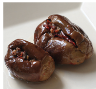
مَكْدُوس makdūs kleine aubergines, gevuld met walnoten en paprika