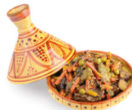
طَاجِين tājīn de tajine (stoofgerecht, bereid in een aardewerken schotel met kegelvormig deksel)