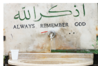
سَبِيل مَاء sabil mā' de waterbron (monument voor een overledene)