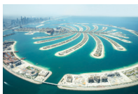
جَزِيرَة النَّخِيل jazirat an-nakhil de palmeilanden (Dubai)