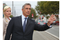
een taxi aanroepen أَشَارَ لِتَاكْسِيٍّ ashāra li-tākṣi