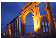
آثَار تَدْمُر āthār tadmur de ruïnes van Palmyra