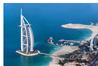
بُرْج الْعَرَب burj al-'arab het Burj al Arab-hotel (Dubai)