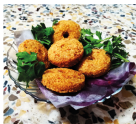
فول وَ طَعْمِيَّة fūl wa ta'miya gefrituurde balletjes van gepureerde tuinbonen