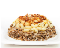
كُشْرِي kushari gerecht van gekookte pasta, rijst, kikkererwten en linzen