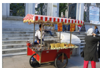
بائع مُتَجَوِّل bā'i' mutajawwil de straatverkoper