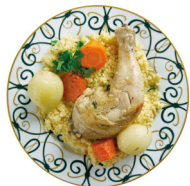
مَفْتُول maftūl de couscous met kip