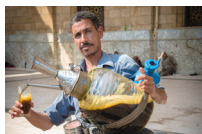
بائع تَمْر هِنْدِي bā'i' tamr hīndī de tamarinde- en dropverkoper