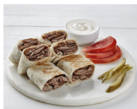
شَاوْرْمَا shāwirmā de shoarma