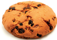
il pandolce kerstcake uit Genua