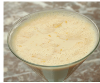
lo zabaione de zabaione (crème van ei, suiker en marsala)