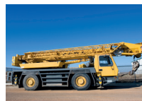
de mobiele kraan l'autogru