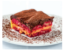
la zuppa inglese biscuitdessert met crème en likeur