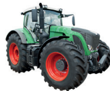
de tractor il trattore