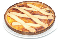
la pastiera taart van zanddeeg, gevuld met ricotta en gekonfijte vruchten