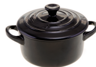
de stoofpan la casseruola