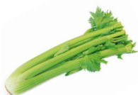
de selderij il sedano