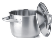
de kookpan la pentola