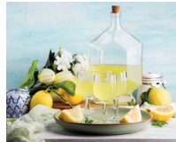
il limoncello de citroenlikeur