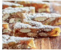
il panforte brood met rozijnen uit Siena