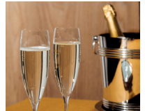
il prosecco de prosecco (mousserende wijn)