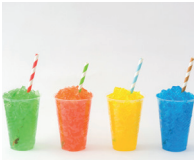
la granita drank van gemalen ijs met vruchtensap