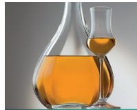
la grappa de grappa (Italiaanse brandewijn uit druivenresten)