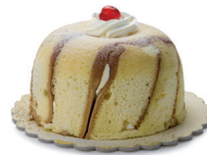
lo zuccotto halfbolle cake met slagroom, gekonfijte vruchten en biscuit, gekoeld opgediend