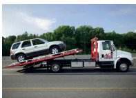
de sleepwagen il carro attrezzi