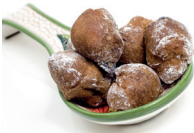
la frittella kleine beignet van gistdeeg met likeur