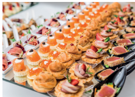
le traiteur de traiteur/cateraar