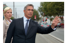
een taxi aanroepen faire signe à un taxi