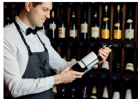
le caviste de wijnhandelaar