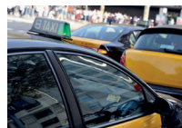
de taxistandplaats la station de taxis