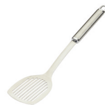
de bakspatel la pelle (à poêle)