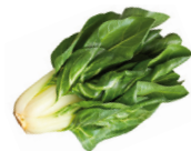
de snijbiet la bette