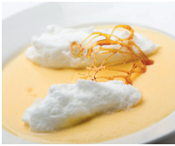
l'île flottante het dessert van eiwit- schuim drijvend in vanillesaus