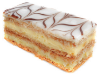
le millefeuille de tomposes