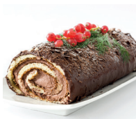
la bûche de Noël de boomstam (gegeten met kerst)