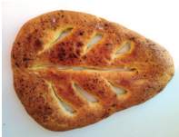
la fougasse het Provençaalse platte brood met olijfolie