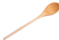
de pollepel la cuillère en bois