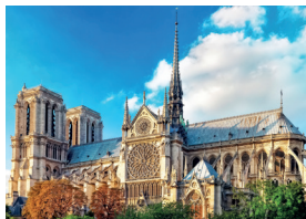
la Cathédrale Notre-Dame de Paris (la Notre-Dame ) de Notre-Dame