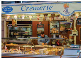
la crèmerie de zuivelwinkel