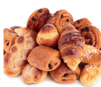
la viennoiserie de luxebroodjes (van bladerdeeg)