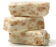
le nougat de noga