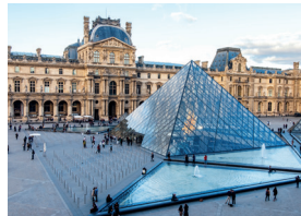
le Musée du Louvre het Louvre