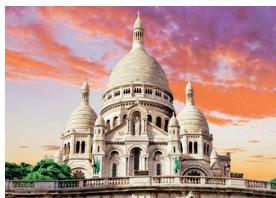
la basilique du Sacré-Cœur de Sacré-Coeur