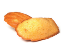
la madeleine het cakeje in schelpvorm