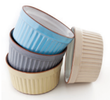
de ramequin le (petit) moule à soufflet