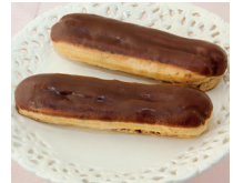
l'éclair de langwerpige roomsoes met glazuur