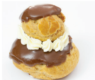
la religieuse twee gestapelde soesjes met chocolade