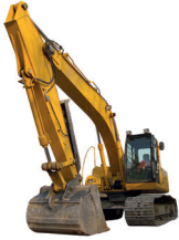
de graafmachine la pelleuse