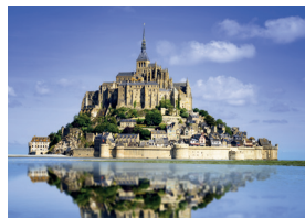
le Mont-Saint-Michel de Mont-Saint-Michel in Normandië