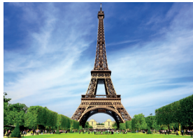
la Tour Eiffel de Eiffeltoren