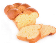
la brioche de brioche (zacht, zoet brood)