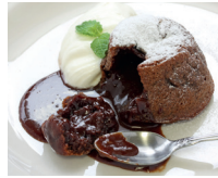
le fondant au chocolat het warme chocolade- cakeje met vloeibare kern