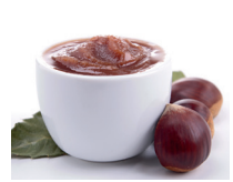
la crème de marron de kastanjecrème