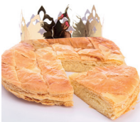
la galette des Rois de driekoningenkoek (hierin is een klein geluks- voorwerp verstopt)