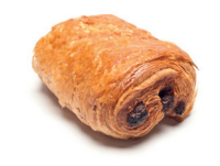
le pain au chocolat de chocoladecroissant