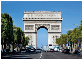
l'Arc de Triomphe de Arc de Triomphe