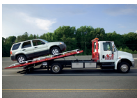
de sleeperwagen la dépanneuse