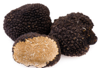
de truffel la truffe