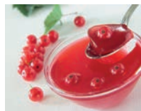
кисіль m [ke'sɪlʲ] de kissel (gebonden vruchtensap)