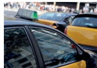
de taxistandplaats стоянка таксі ф [sto'jankə tek'si]