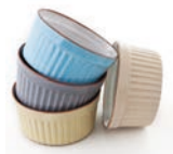
de ramequin формочка для запікання f [ˈformɛʦkə dɪʔa zapʲiˈkanˈjɛ]

de vleesvork виделка для смаження f [ˈvɛʔelkə dɪʔa sˈmɛzənˈɛ]