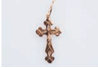
хрестик m [xrestik] het halskruis