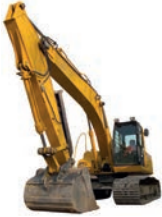
de graafmachine екскаватор м [ɪkskə'vɑtər]