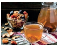
узвар m [uz'var] de oezwar (jam van gedroogde vruchten en honing)