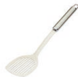
de bakspatel лопатка м [ɪˈpɑʔkə]