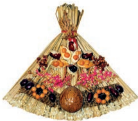
оберіс m [ɔbɛ'rɪsʲ] de geluksbrenger (beschermt tegen rampspoed en staat symbool voor een over- vloedige oogst)