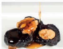
чорнослив mv [tʃɔr'nɔslɪv] met walnoten gevulde pruimen