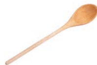
de pollepel мішалка f [mɪˈʃɑʔkə]