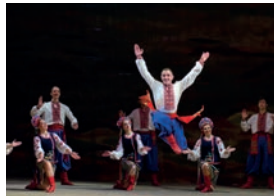
аркан m [er'kan] de arkan (Hoezoelische volksdans voor mannen)