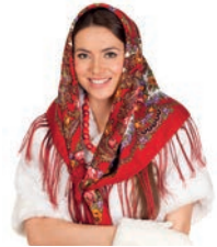
хустка f [xustka] de hoofdoek