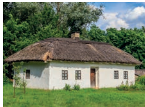
стриха f [s'trɪxɐ] het rieten dak