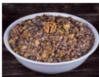
кутя f [ku'tʲa] de koetja (zoet kerstgerecht van gekookte tarwe, honing, stukjes noot, maanzaad en rozijnen)