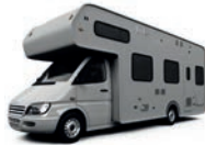
de camper трейлер м [treɪlər]