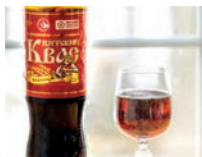
квас m [kvas] de kvas (koolzuurhoudende frisdrank)