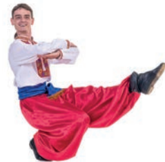
козачок m [kotsä'tʃək] de kazatsjok (Oekraïense volksdans)