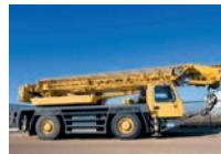
de mobile kraan автомобільний кран м [ɛʏtəmo'bɪl'neɪ kran]