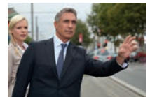
een taxi aanroepen ловити таксі [ɪə'vəʁə tek'si]