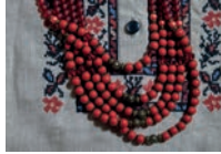
намисто n [nə'mistə] de halsketting