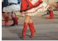
черевички mv [tʃerɛ'viitʃki] de veterlaarzen