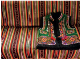
кептар m [kep'tar] de keptar (traditioneel vest uit de Karpaten)