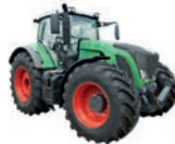
de tractor трактор м [ˈtraktər]