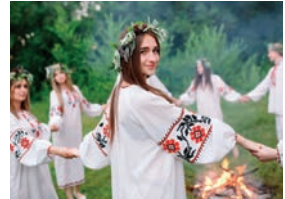
хоровод m [xarə'vot] de rondedans (folkloredans met meerdere synchroon bewegende dansers)