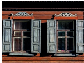
віконниці mv [vɪ'konɛtsɪ] de raamblinden