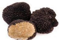
de truffel трюфель m [ˈtʁʉfɛl]