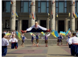
гопак m [ɦe'pak] de hopak (Oekraïense volksdans uit de tijd van de Zaporozje-Kozakken)