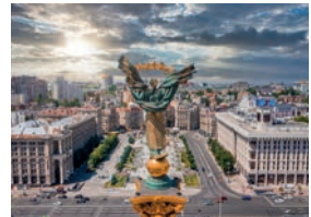
Майдан Незалежності m [maj'dan neza'leznosci] de Maidan (onafhankelijkheidsplein)