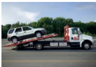
de sleepwagen евакуатор м [ɛvaku'ɑtər]