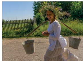
коромисло n [kɔrɛ'mislɔ] het draagjuk