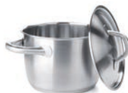
de kookpan каструля f [keˈstruːlɛ]