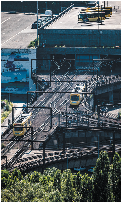
Metrostellen bij halte Palais.

De metro van Charleroi wordt vaak als eerste voorbeeld genoemd in discussies over Grand Travaux Inutiles. Maar is de metro wel een Nutteloos Bouwwerk? De metrostellen op de ringlijnen rond de kernstad – le boucle central met de M1, M2 en M4 – zitten vrijwel altijd behoorlijk vol. In een dense en verkeerszieke stad met veel autoverkeer en weinig infrastructuur voor fietsers voldoet de metro wel degelijk aan een behoefte. Dat is minder het geval op de antennenetten naar de buitenwijken, maar daar is de metro eigenlijk een bovengronds rijdend trammetje. Je kan de lijn