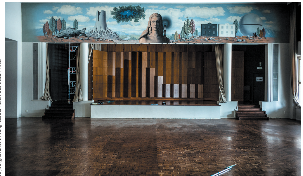
La fée ignorante in Congreszaal Palais des Beaux-Arts.

Thuis groeide Magritte op in een gezin dat we vandaag disfunctioneel zouden noemen. Vader Léopold Magritte was lang een selfmade man van twaalf stielen en dertien ongelukken. Op zijn cv staan onder meer de beroepen van kleermaker, verkoper van verzekeringen en handelsvertegenwoordiger in sauzen. Hij vergaarde een fortuin toen hij kon opklimmen tot inspecteur-generaal bij een voedingsbedrijf in Dendermonde. Met het geld werd het huis aan de Rue des Gravelles gebouwd. Als vader was hij vaak afwezig, en als hij thuis was toonde hij zich koppig en dominant. Hij sprak de kinderen aan met 'u' en verbood het Waalse dialect in huis. Hij had losse handjes, ook tegenover zijn vrouw. De kerk wekte een diepe afkeer bij hem op.