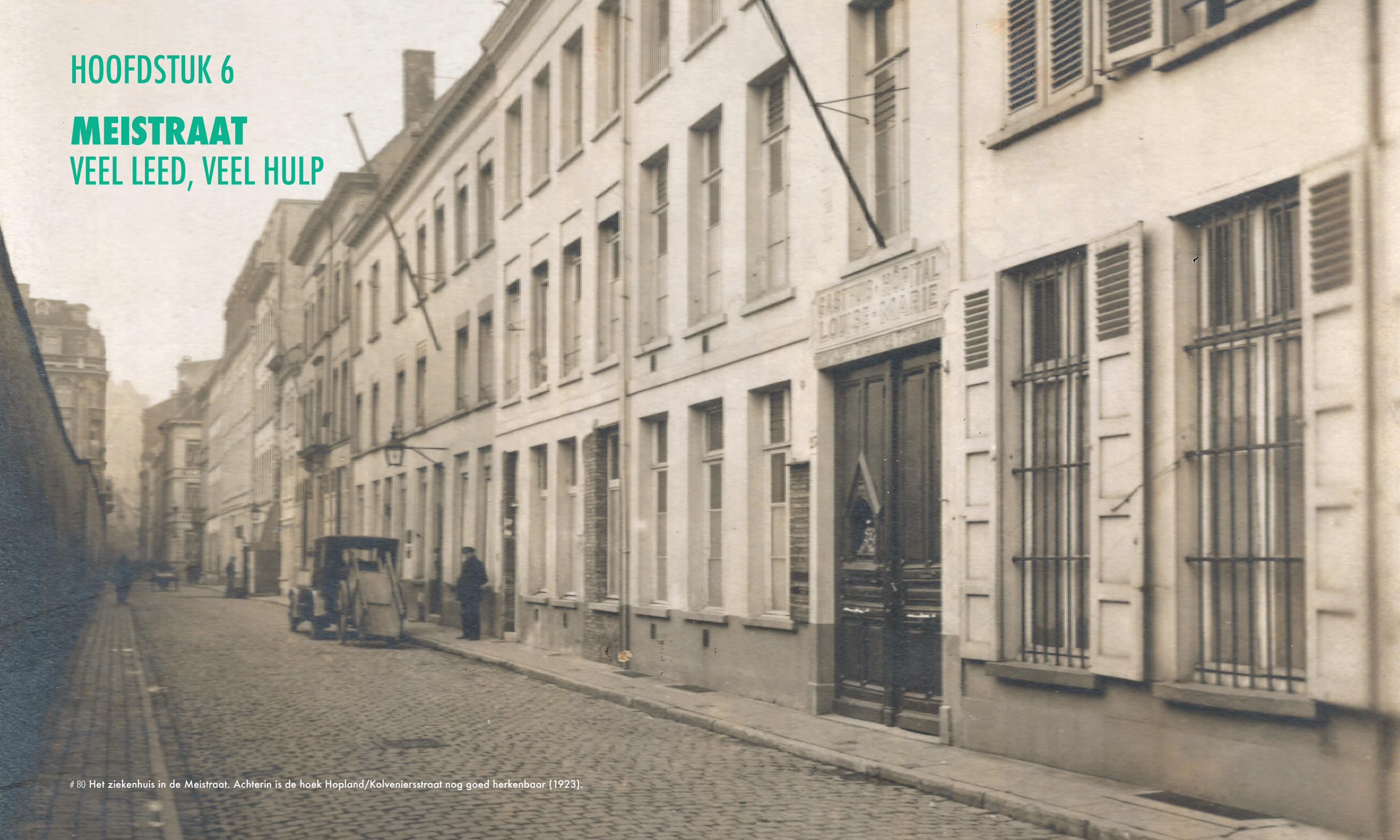
# 80 Het ziekenhuis in de Meistraat. Achterin is de hoek Hopland/Kolveniersstraat nog goed herkenbaar (1923).