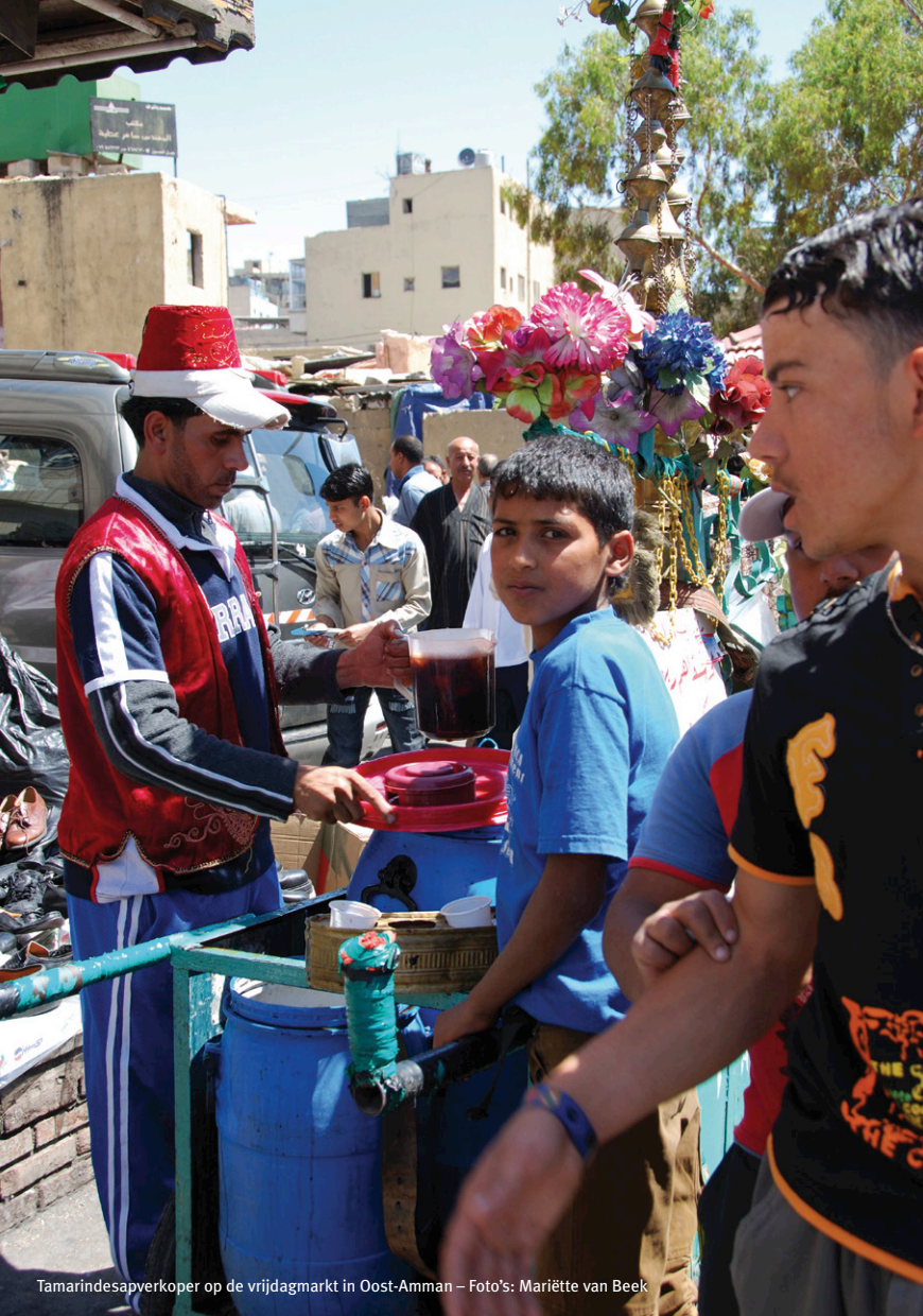
Tamarindesapverkoper op de vrijdagmarkt in Oost-Amman