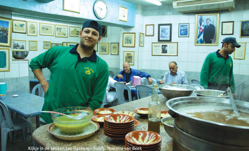
Kijkje in de keuken van Hashem