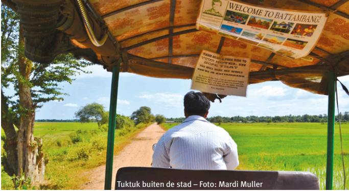
Tuktuk buiten de stad

een mum van tijd ben je op het platteland waar het boerenleven zich afspeelt zoals het al jaren bestaat. Boeren werken op de rijstvelden, koeien grazen langs de weg en enorme waterbuffels baden in een waterpoel. Wat verder buiten de stad ligt Phnom Sampeau, een steile heuvel met halverwege The Killing Caves : een onheilspellende spelonk waar de Rode Khmer tegenstanders naar beneden gooiden, een val van wel tientallen meters. Waar destijds de mensen stierven, staat nu een boeddhistisch altaar en bidden monniken. Het is een heftige confrontatie met de geschiedenis van dit land, en een schril contrast met het prachtige uitzicht vanaf de heuveltop over groene akkers, rijstvelden en bergen.