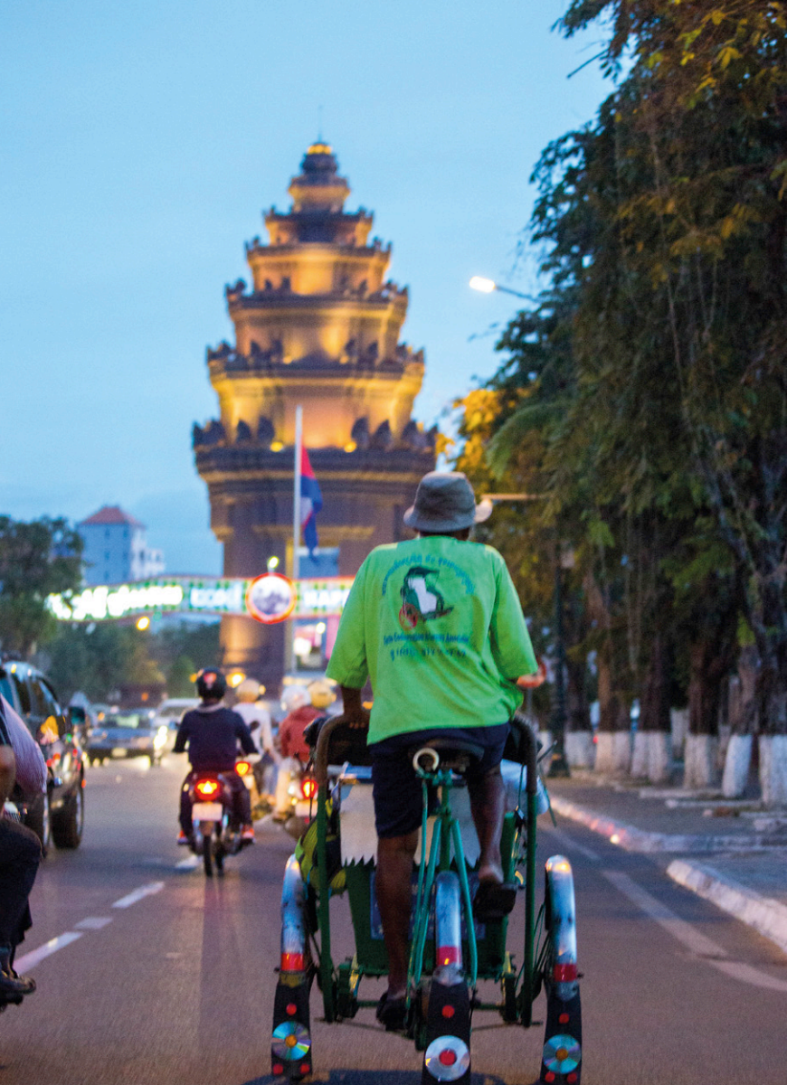
Cyclo in Phnom Penh met op de achtergrond het Onafhankelijkheidsmonument