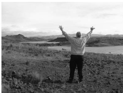
Afb. 4: Terug bij Sillustani in 2012, een herbeleving van wat 25 jaar eerder was gebeurd.