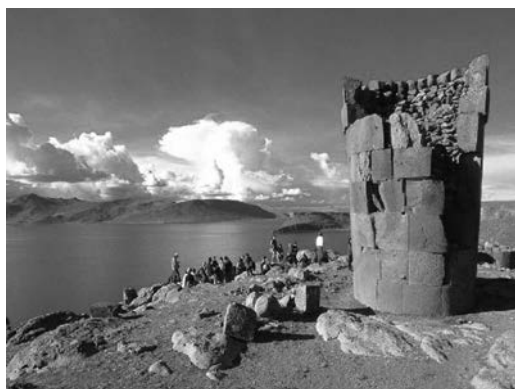
Afb. 3: Het prachtige Sillustani.