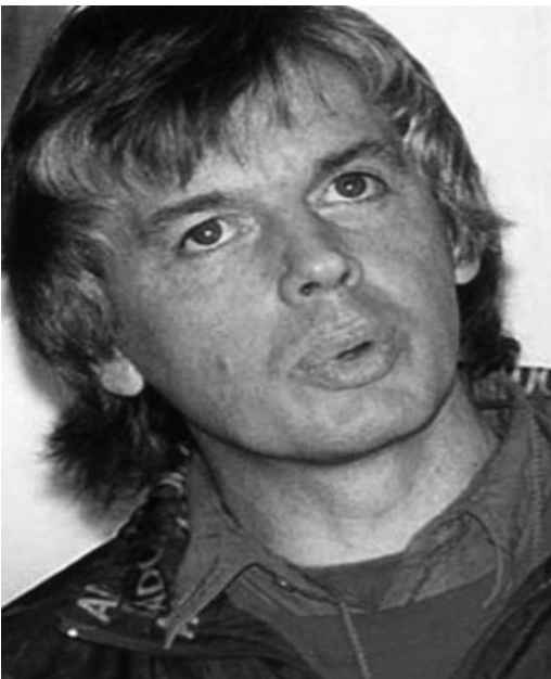
Afb. 5: In andere sferen in 1990 – maar essentieel voor het vervolg.

mensen zien ontwaken, die zich realiseren dat de wereld niet is wat je denkt, en niet is zoals je verteld wordt door regeringsinstellingen en overheidsinstellingen. Ik heb inmiddels een lange lijst boeken geschreven en ik spreek voor duizenden mensen per keer bij evenementen over de hele wereld, informatie delend die ik via allerlei synchroniciteiten in mijn leven heb verzameld over een veelzijdigheid aan onderling verbonden onderwerpen. Allerlei onderwerpen zijn op zichzelf al interessant, maar ze met elkaar verbinden heeft een extra groot effect door de inzichten die eruit volgen. De synchroniciteiten in de eerste jaren na Betty Shine en Peru hebben