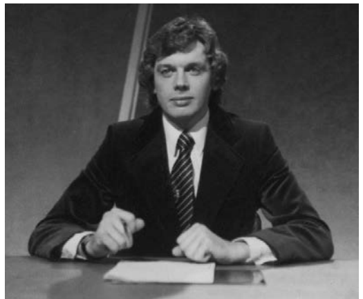
Afb. 1: Op weg naar geestelijke gezondheid.