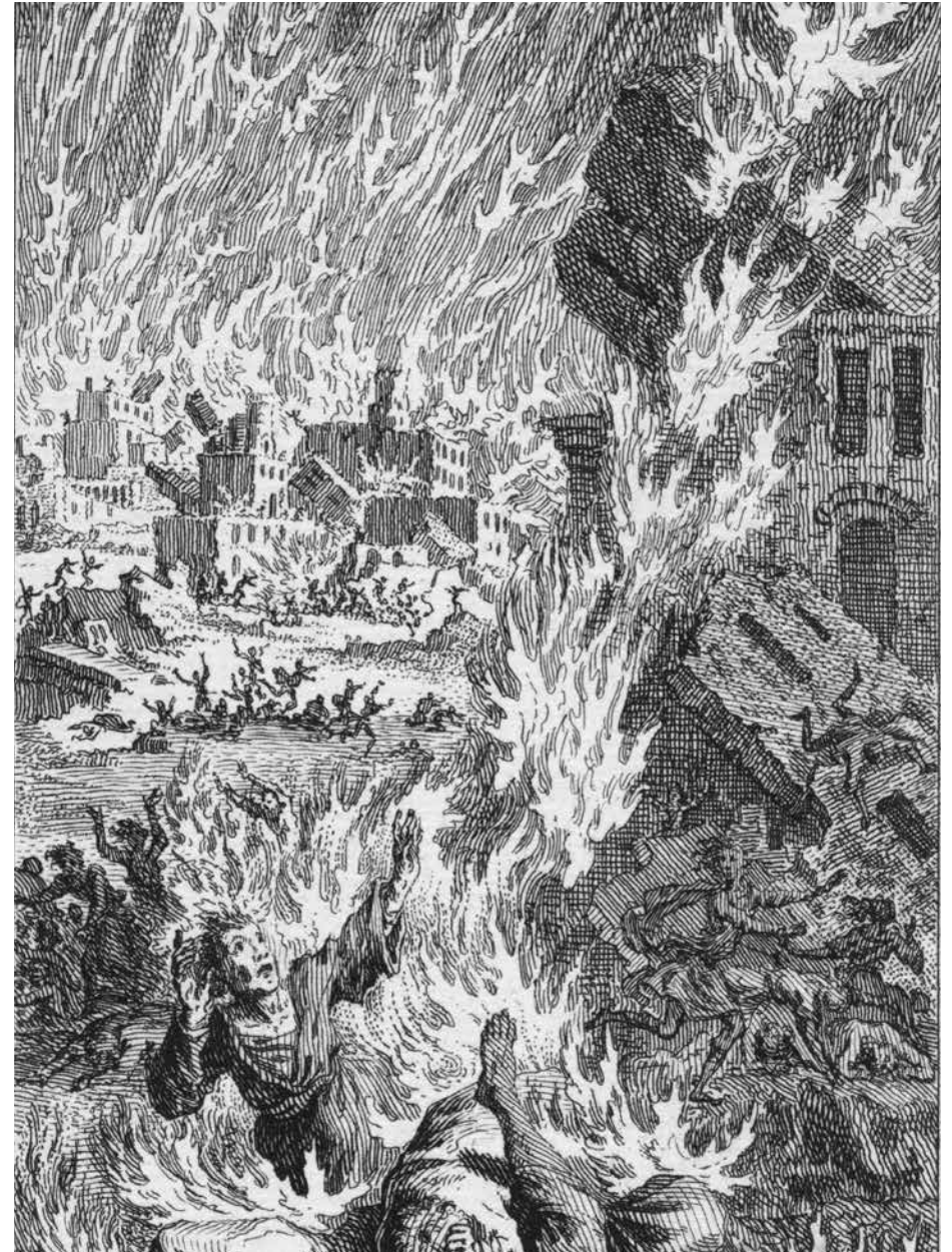
Het apocalyptische beeld van Sodom en Gomorra die in vlammen opgingen, vormde eeuwenlang de basis om homo-erotische verlangens te veroordelen.

Het zou tot de achttiende eeuw duren voor deze opvattingen voorzichtig uitgedaagd werden. Volgens de Franse Verlichtingsfilosofen was sodomie veeleer een sociaal probleem dan een religieuze zonde. De overheid zou zich dan ook beter concentreren op preventie in plaats van op bestraffing. Onder hun invloed werd, ook in de Belgische gebieden, de term 'sodomie' bij mannen steeds vaker vervangen door het begrip 'pederastie'. Ook die term was echter allerm minst eenduidig. Etymologisch verwijst pederastie immers naar erotische relaties tussen volwassen mannen en opgroeiende adolescenten, een veelvoorkomende praktijk in die tijd, zoals zal blijken in het vierde hoofdstuk. In het dagelijkse leven was het begrip echter ook van toepassing op betrekkingen tussen volwassen mannen.