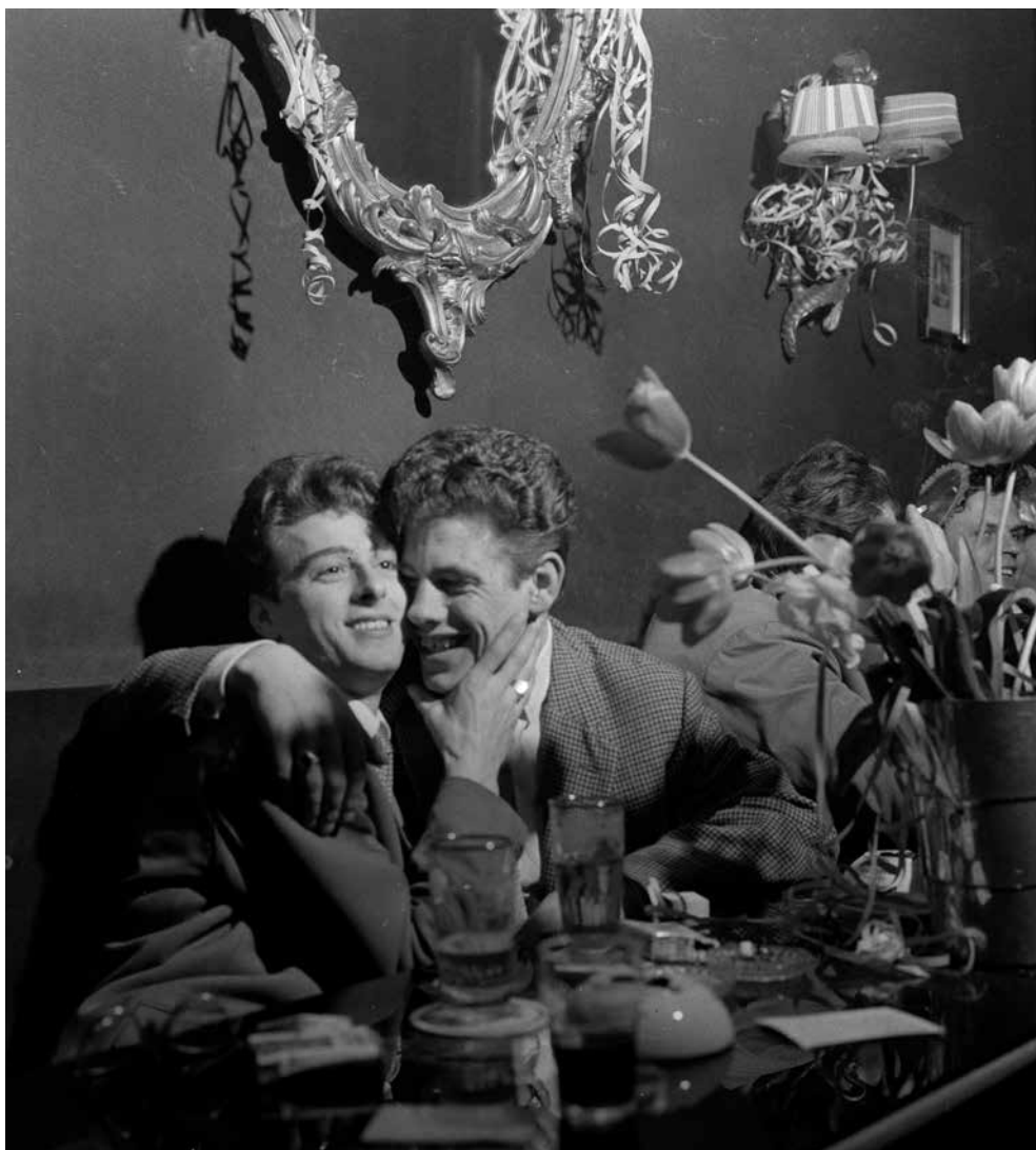
Foto genomen door Cas Oorthuys in een Brusselse homobar tijdens de jaren 1950.

Rotterdam, Nederlands Fotomuseum. Met dank aan Jan Carel Warffemius.