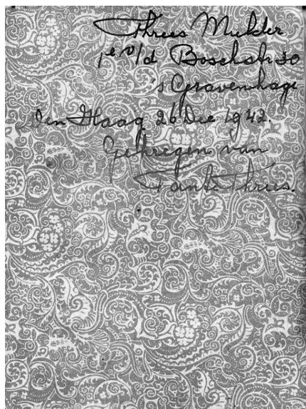
Afbeelding 12: Schutblad verjaardagsboekje