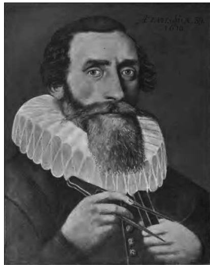
Johann Kepler, geboh den 27. Dezember 1571 zu Weil den Stadt gestorben zu Regensburg den 8.ten November 1630.

Es empfiehlt sich, mindestens drei volle Gläsern polnischen Bieres und einige Glaschen polnischen Wodka zu degustieren, bevor man sich ins Augustiner-Chorherrenstift begibt. Gar grässlich die ausgestellten Gebeine, Gerippe, Totenschädel und Überbleibsel angeblich Heiliger, im Wahrheit vermutlich Hingerichteter oder über sonstige Leichenschändung in Kirchenbesitz gelandeter Reliquien. Man unterdrücke Würgereiz und arbeite sich sodann zielstrebig zur Klosterbibliothek vor.