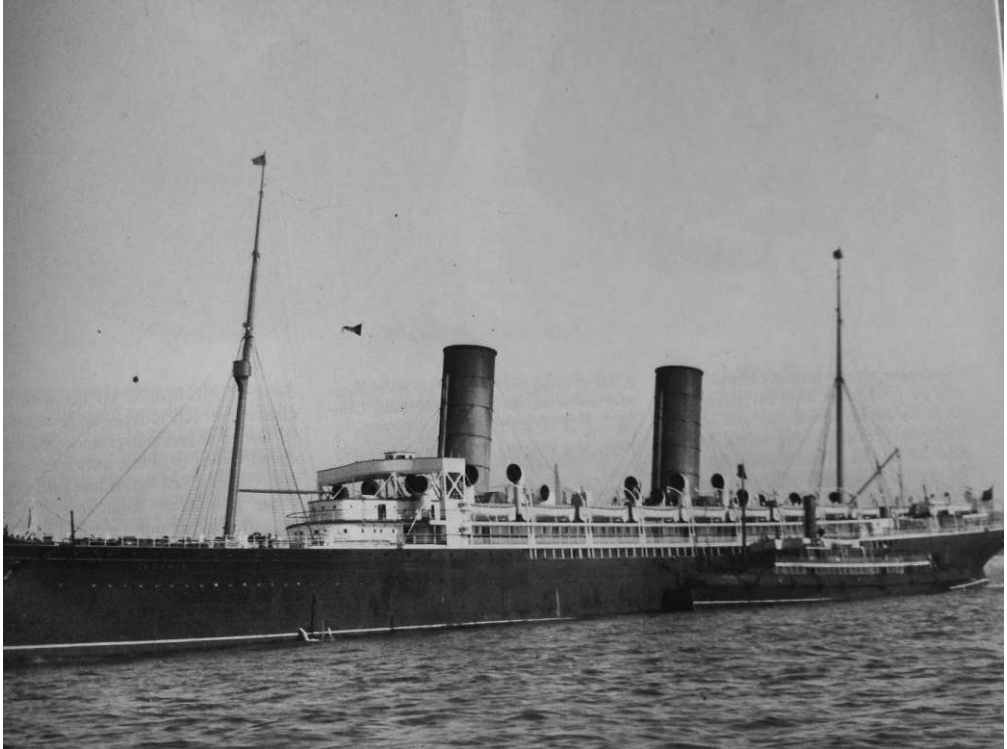
3. De RMS 'Lucania' van de Cunard Steamship Company waarmee Kuyper de oversteek naar Amerika maakte.