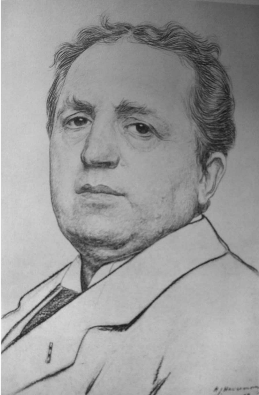
1. Abraham Kuyper, getekend door H.J.Haverman anno 1897.