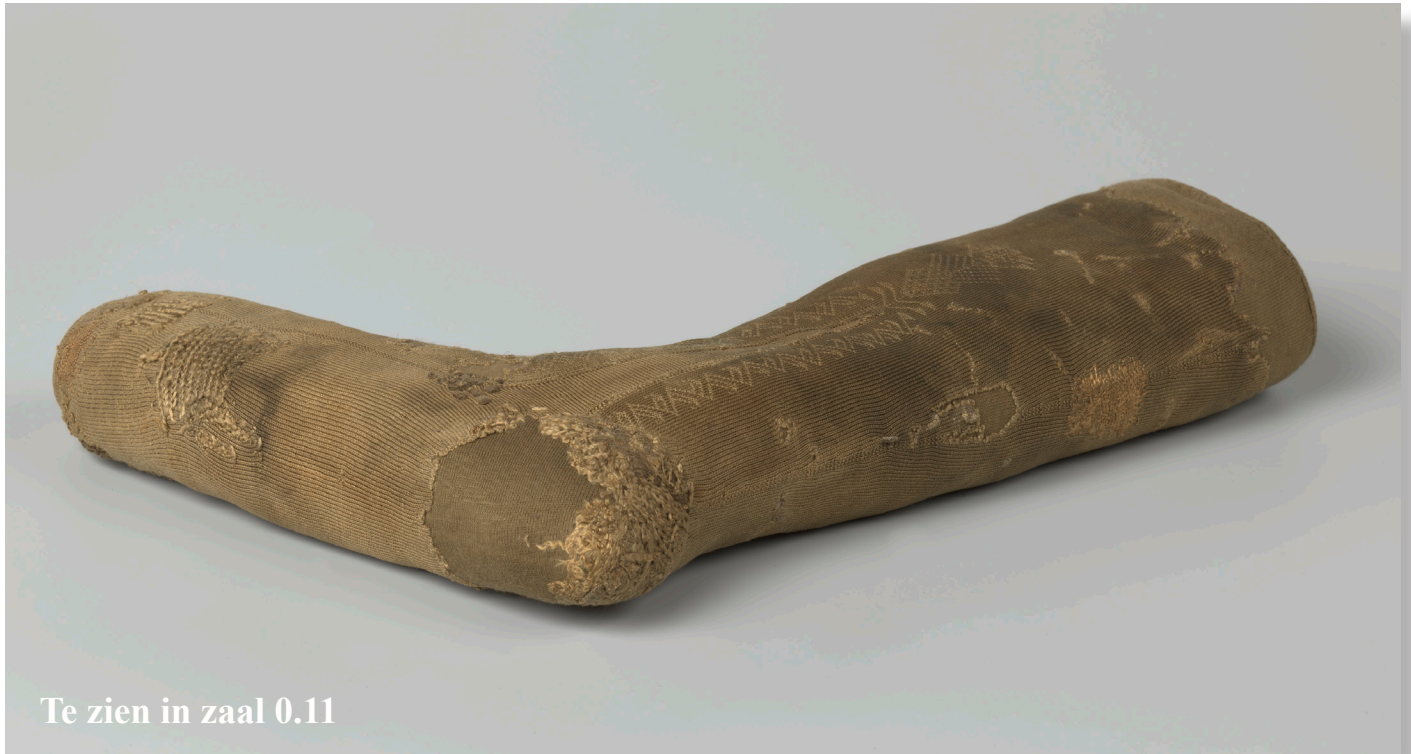
Te zien in zaal 0.11

Gebreide zijden kous in het Rijksmuseum, gevonden in 't Vliegend Hart, het VOC schip dat op 3 februari 1735 voor de kust van Vlissingen zonk.