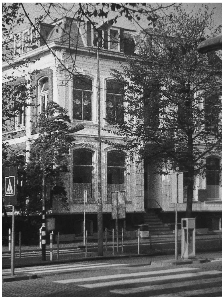
Dreefschool aan de Dreef 20 te Haarlem